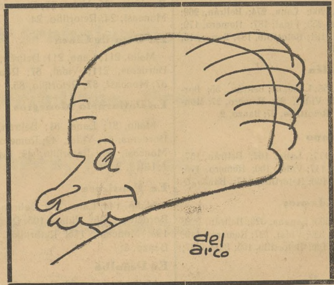
D. Francisco Largo Caballero Líder del Frente Popular de Izquierdas