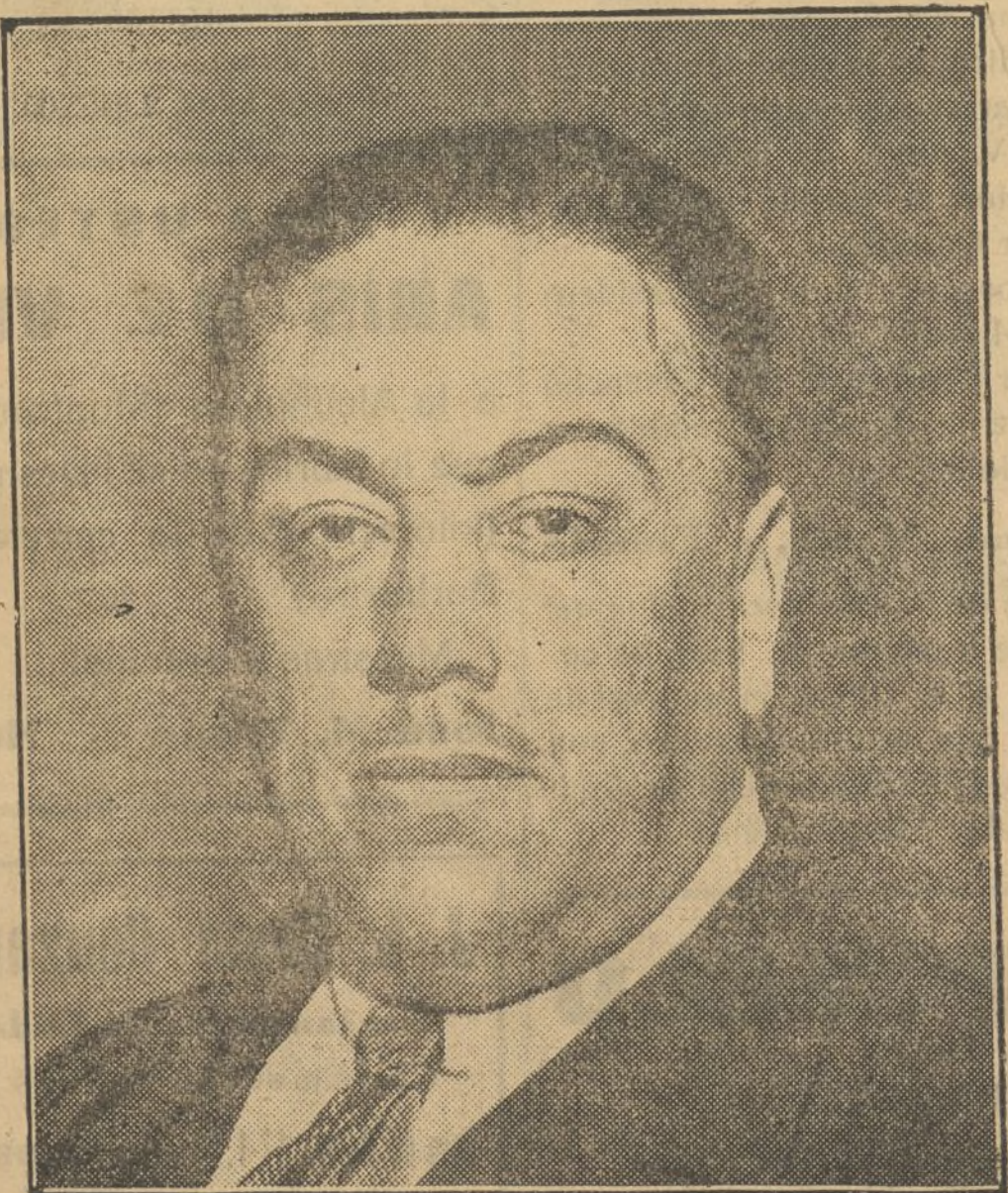
D. Diego Martínez Barrio Líder del Frente Popular de Izquierdas