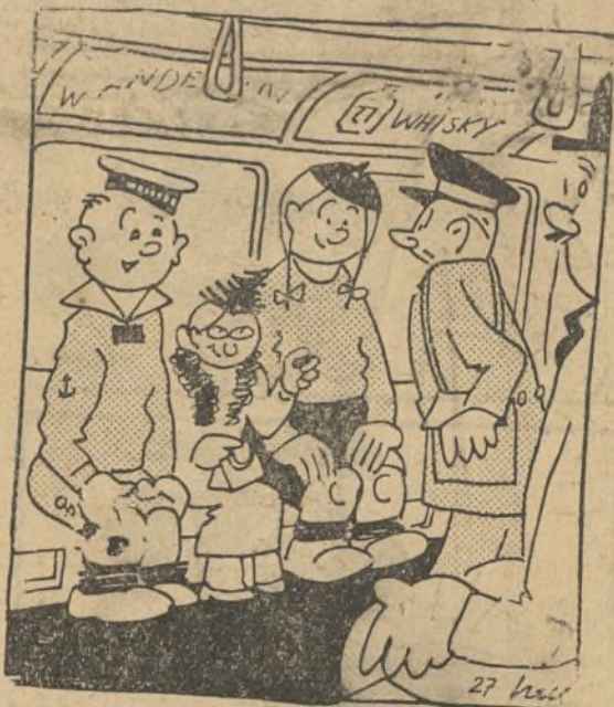
—Un billete para mí y medio para los niños