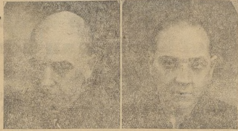
CALVO :- 28 años TRATAMIENTO :- 11 meses

Curación de la calvicie garantizada. La salida del pelo en seis meses, con CAPILAR J. MOURADE