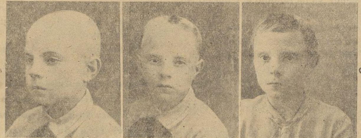
Calvo nacimiento. Tratamiento tres meses. Siete meses.

NOTA.—El día 5 se encontrará en Jaca, en el Hotel Mur.