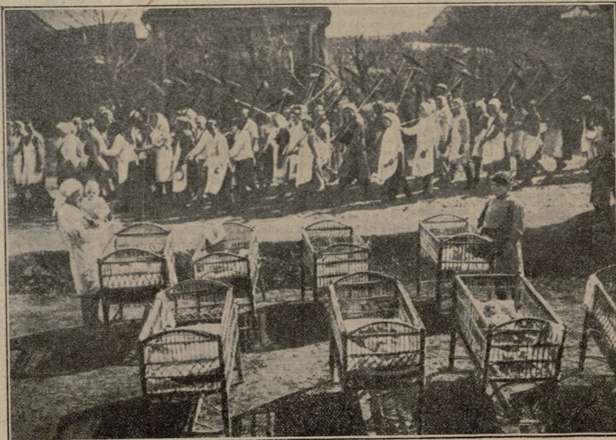
Una casa-cuna para hijos de campesinas rusas.

(Del libro «Dinamarca», publicación oficial del Estado danés.)