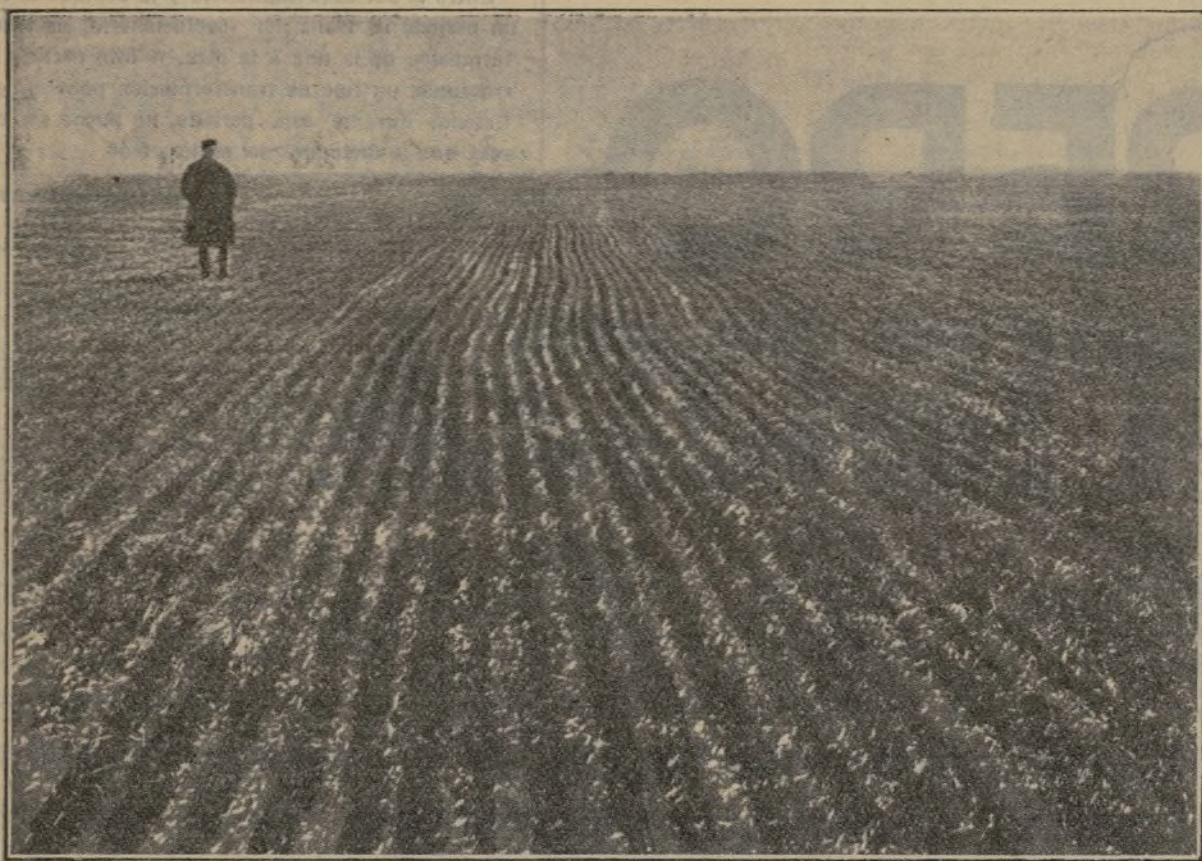
Hoy el campesino ruso es dueño de la gran estepa.