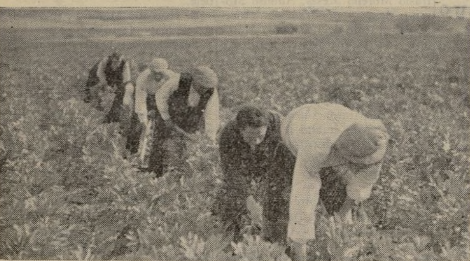
Una finca colectiva en Móstoles