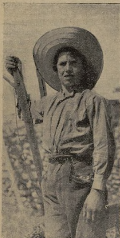
El comunero más joven de Santa Cruz de la Zarza

Pero donde llegamos al colmo de lo inaudito, es en el estado de la situación de caja; según acta o arqueo levantada el 28 de marzo último, debiera existir, en metálico, la suma de 10.648,39 pesetas; pero el depositario no tiene en su poder más que 1.500 pesetas.