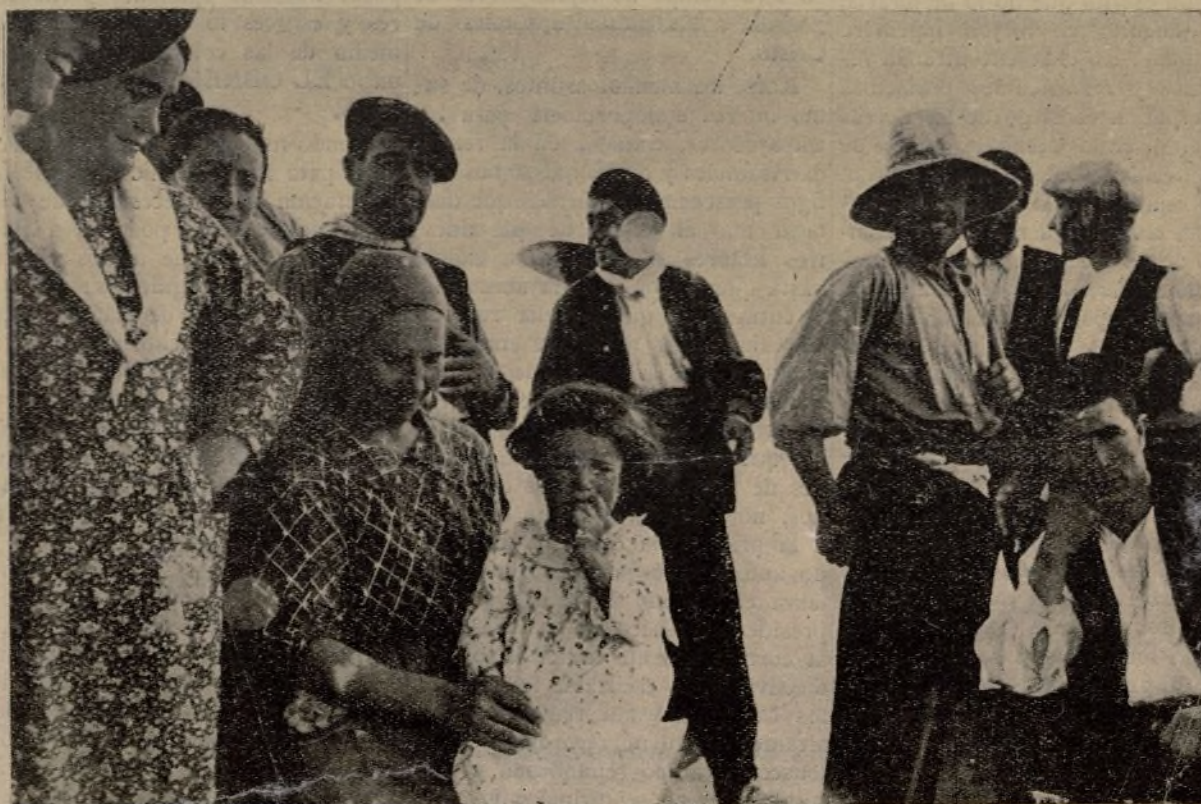
La alegría en todos los rostros, un sentimiento de alivio y de esperanza en todos los corazones