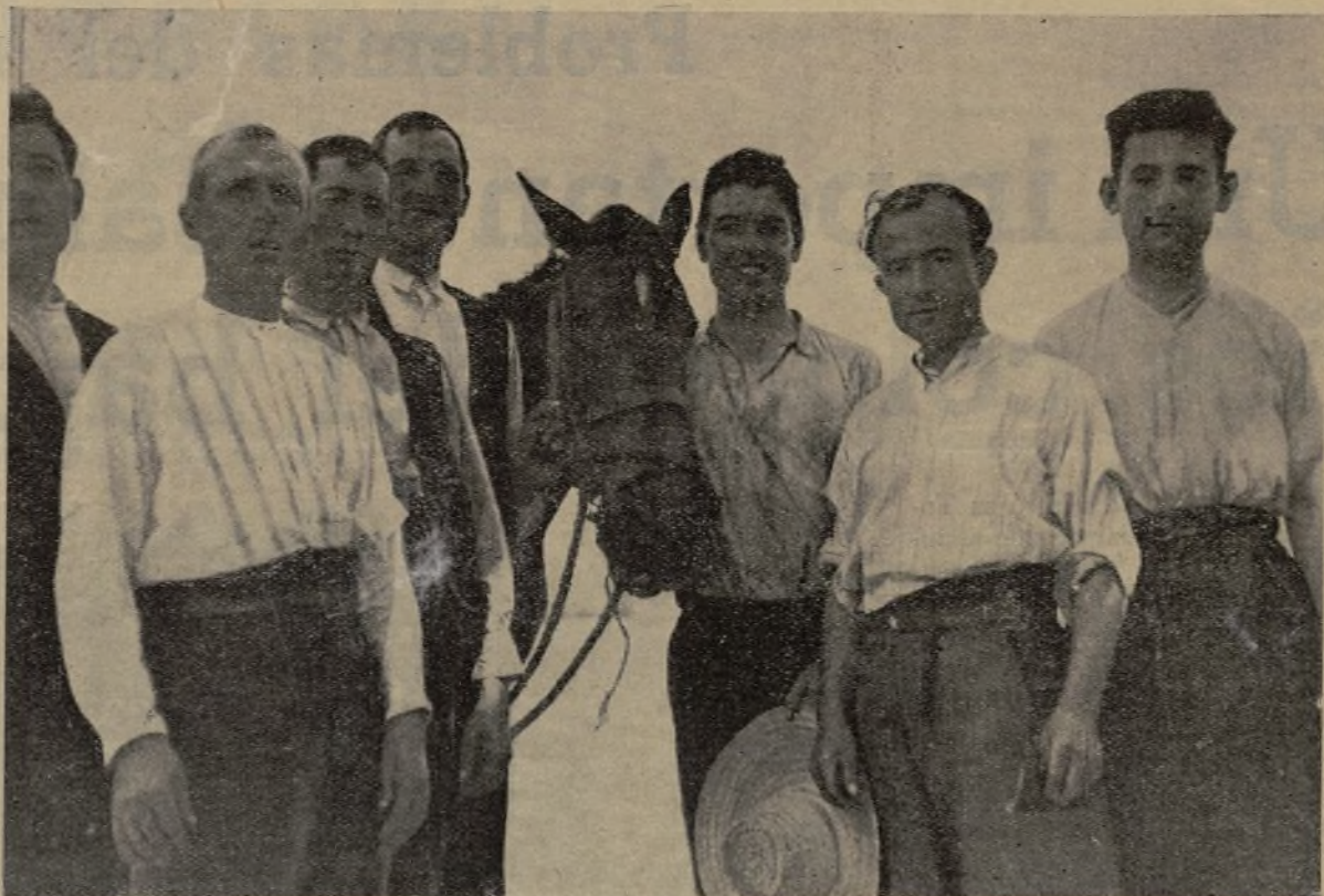
[Por esto lucharon y sufrieron cárcel y malos tratos].—Compañeros presos cuando la Huelga Grande

Hay en la Comunidad un grupo de campesinos que sabrá mantener en ella la cohesión necesaria, a lo largo de las dificultades que vayan surgiendo en su cami-