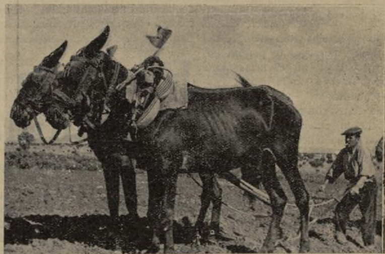
Hasta las mulas de la Comunidad van engalanadas de rojo

Liquidaciones de presupuestos—y a saber en qué condiciones—no existen más que las de 1931 y 1932. ¿Qué procedimientos debe seguirse ahora para saber con exactitud el déficit o superávit municipal y