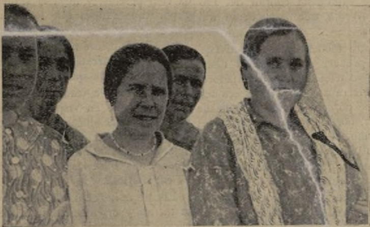
Las compañeras de los comuneros no se quedan atrás en las tareas de la Comunidad

buenas que existen en su término municipal, cuenta con maquinaria y ganado suficientes para el trabajo y tiene facilidades para completar la explotación agrícola con la cría de un rebaño de ovejas