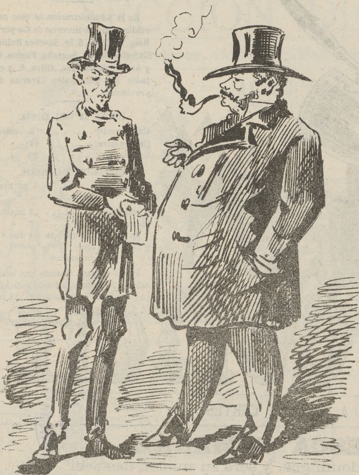
TENEDOR DE BILLETES ACCIONISTA.