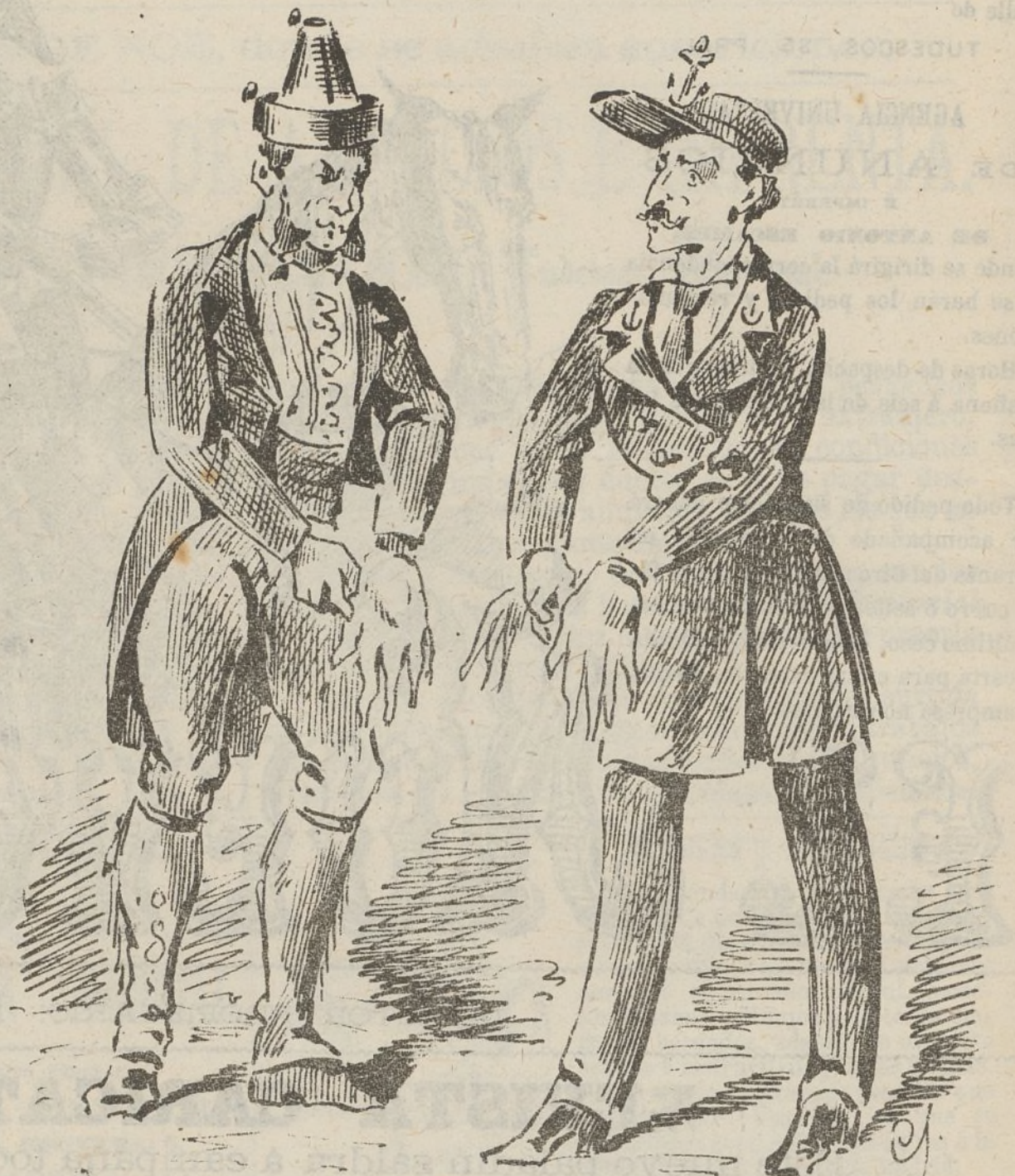
PREPARÁNDOSE PARA LAS FIESTAS.