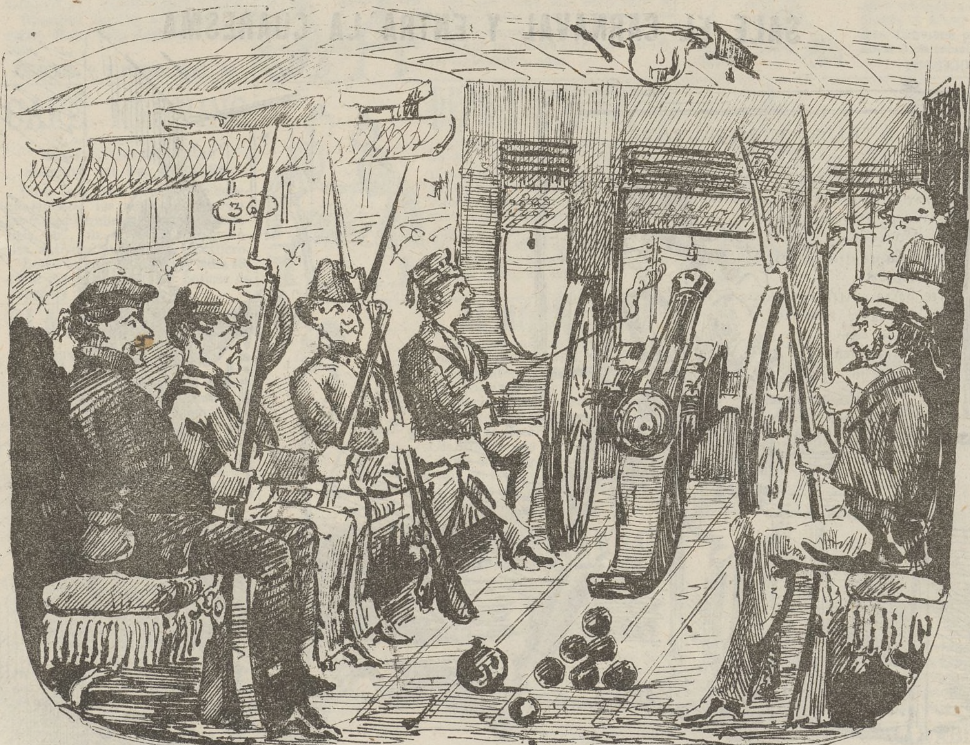
ASPECTO INTERIOR DE UN COCHE DE VIAGEROS EN EL FERRO-CARRIL DEL NORTE.