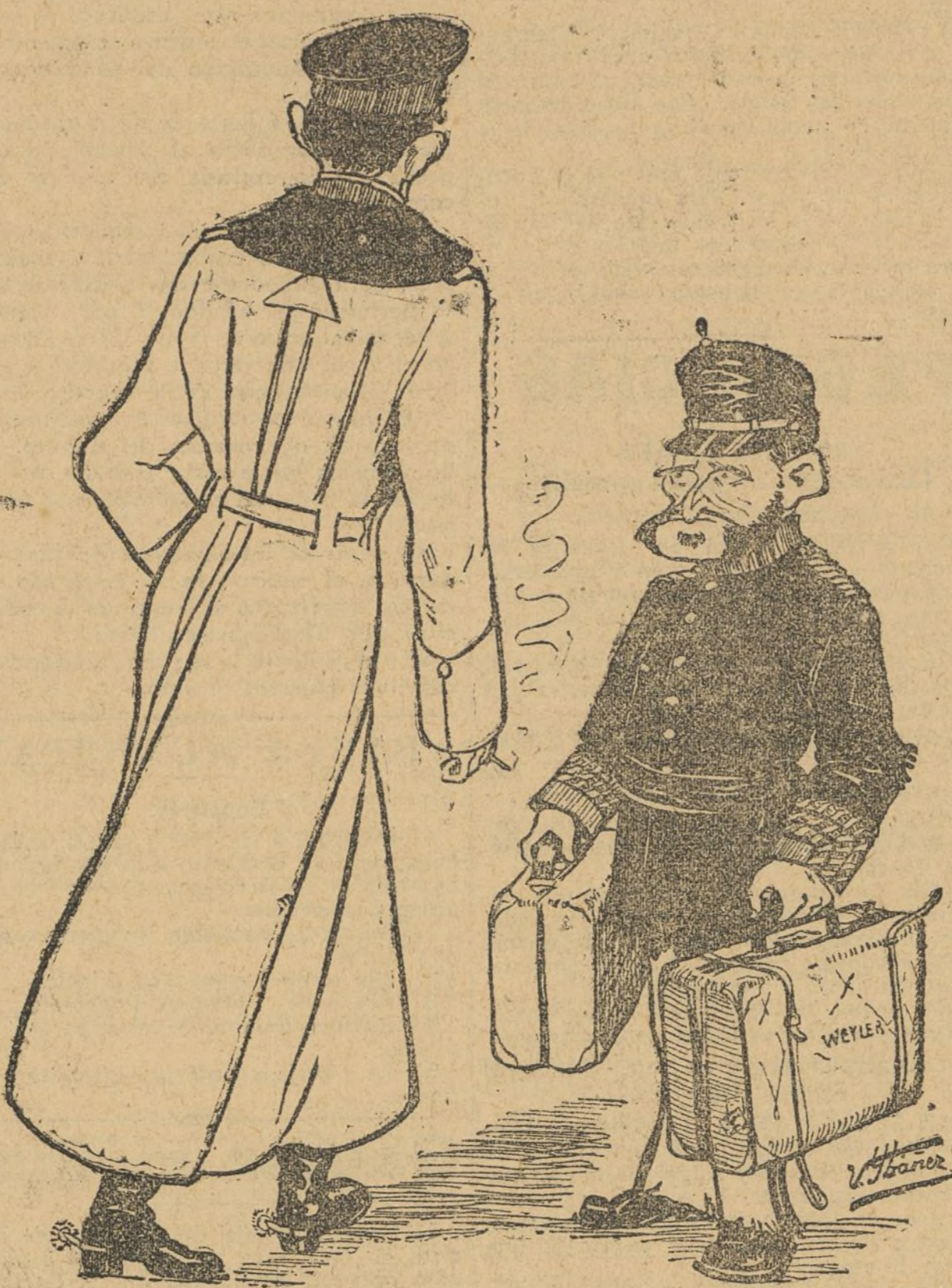
—¿A qué se debe el viajecito? —Pura manifestación de gratitud..., y por si hago falta... para algo...