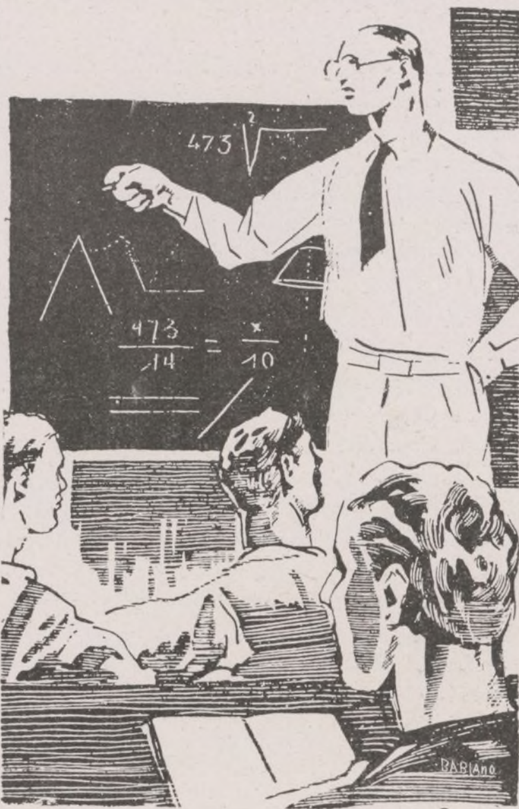
(Dibujo de BABIANO.)

QUE AQUELLOS JOVENES QUE EN EL TRABAJO DE CHOQUE SE DESTACUEN POR SU ABNEGACION Y SU CAPACIDAD TENGAN ACCESO A ESCUELAS TECNICAS Y DE INGENIERIA, EN LAS QUE SE FORJEN LOS CUADROS TECNICOS FIELES AL PUEBLO"