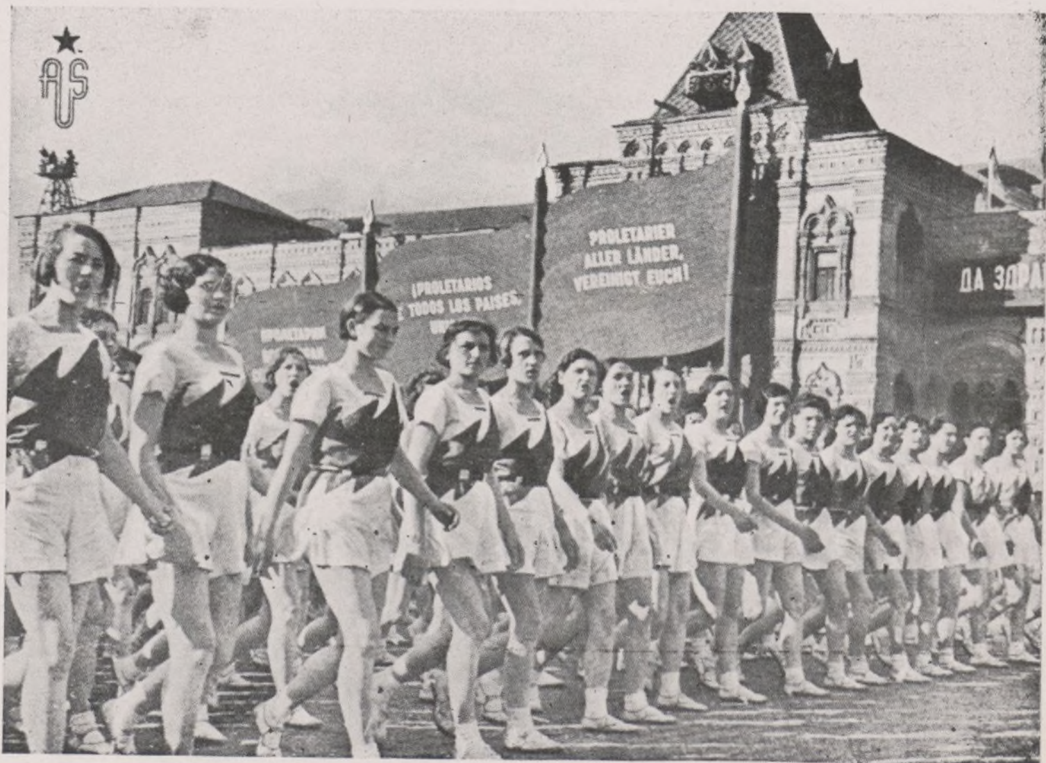
Juventud sana, fuerte, alegre...