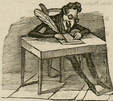
LO QUE LE DÉ LA GANA.

El ejército no se vende ni falta á sus juramentos, añade; preguntando luego ¿quién queda pues? y por supuesto como que quedan los moderados, de ahí deduce el consecuentísimo papelote; que los moderados somos los de la bullanga, los de los motines y asonadas; sino personalmente, por medio de entes comprados alomenos... ¡Ay que gusto!!! los maduros bullangueros! esa si que es mas fresca! ¡y comprando en-