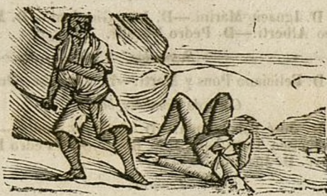
Y APUNTE V.