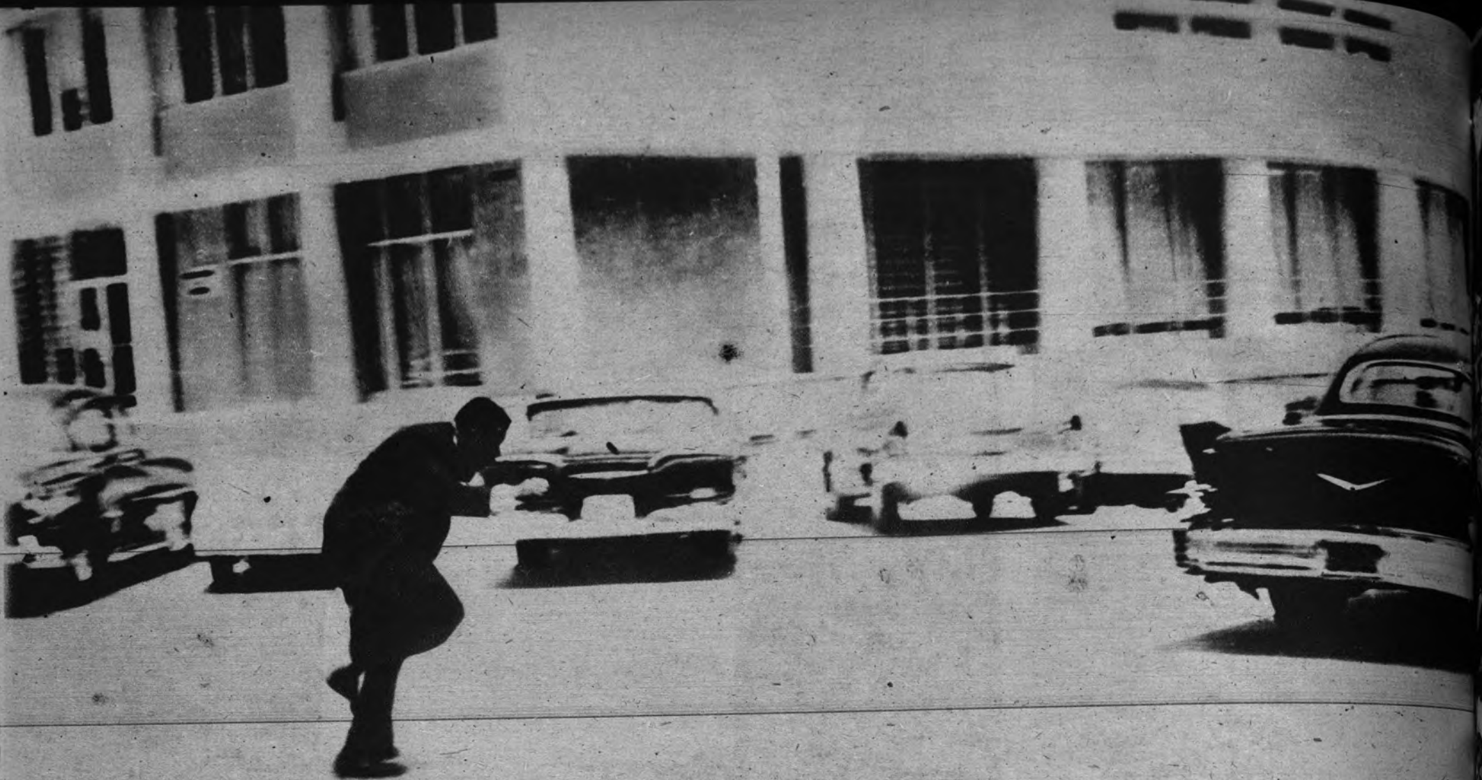
EL PRESIDENTE DE LA CAMARA HONDUREÑA SE RESGUARDA DE LAS BALAS. —Esta expresiva fotografía recoge el momento en que el presidente de la Cámara de los Diputados de Honduras, Modesto Rodas Alvarado, corre a resguardarse de las balas al ser sorprendido por un ataque rebelde a Palacio, durante la pasada y sangrienta revuelta que entró en el país. Las tropas del Gobierno dominaron la situación.