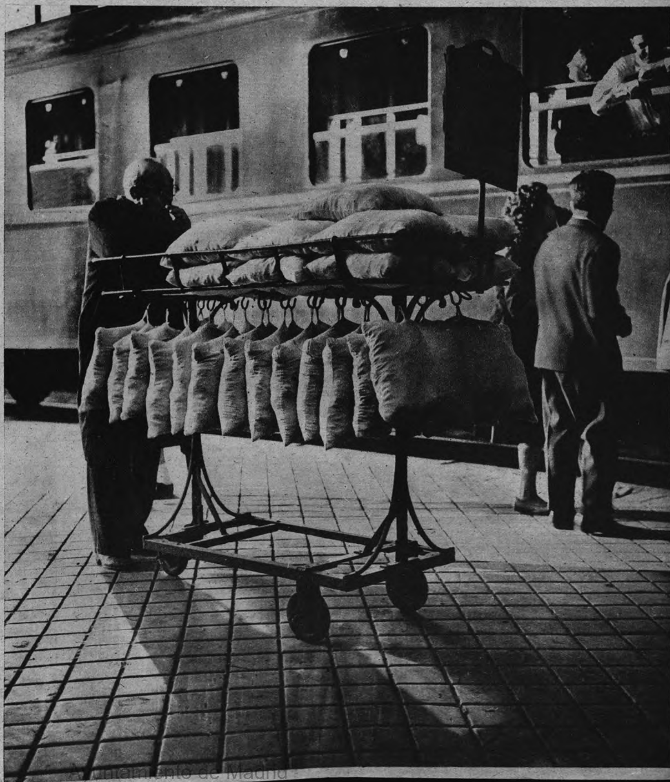
Alimentación de Madrid