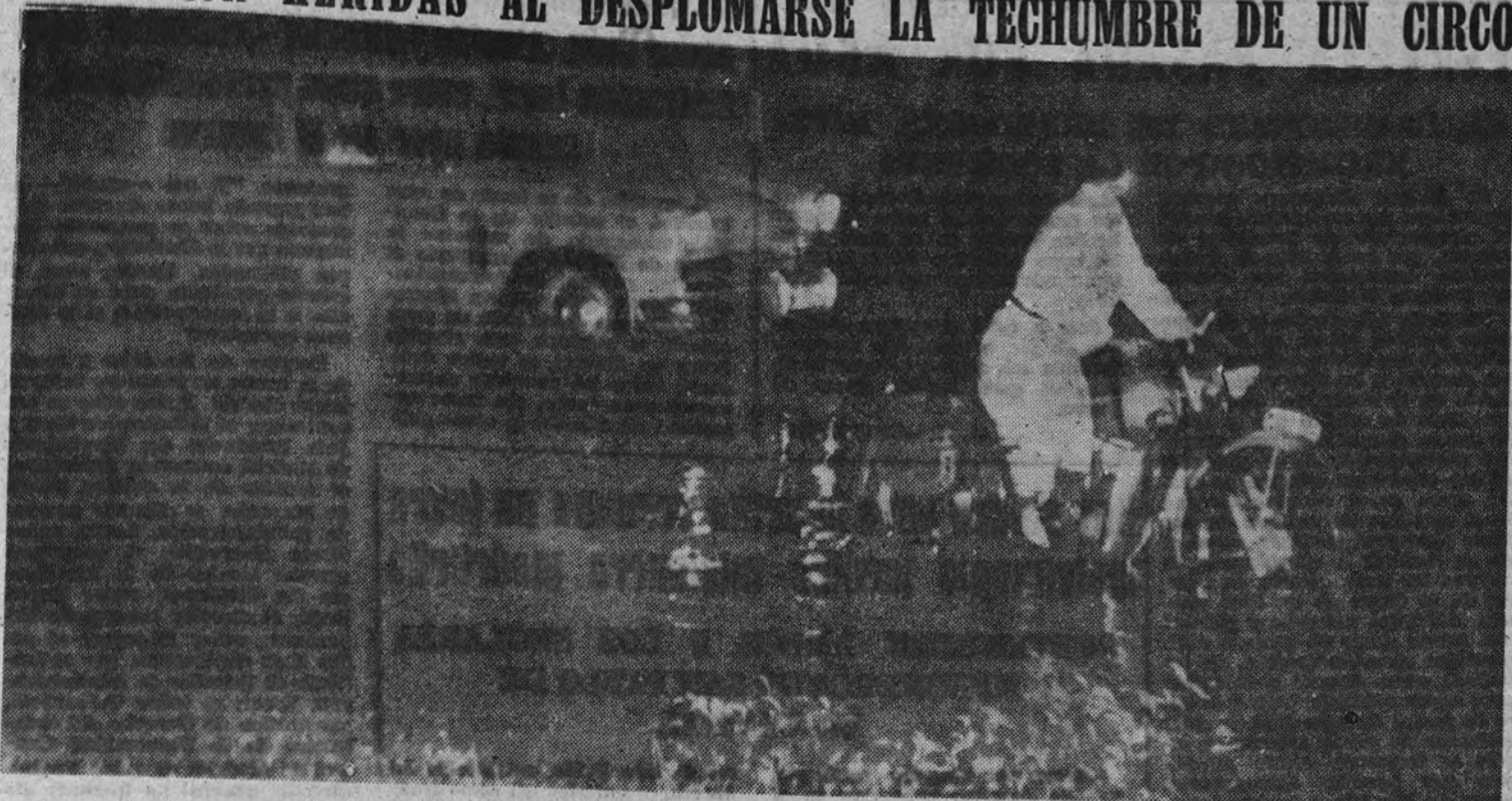
La violenta tormenta que anoche descargó sobre Madrid produjo, en el lapso de breves minutos, graves y aparatosas inundaciones. La plaza de Colón presentaba este aspecto momentos después de cesar la fuerte lluvia

El Servicio de Bomberos tuvo que multiplicar sus habituales medios para atender a la gran demanda de socorro. Entre las once y media de la noche, hora en que comenzó la tormenta, y las dos y media de la madrugada, se recibieron un total de más de quinientas llamadas de socorro, muchas de ellas, como es lógico, repetidas y algunas de falsas alarmas producidas en la desorientación de los primeros mo-