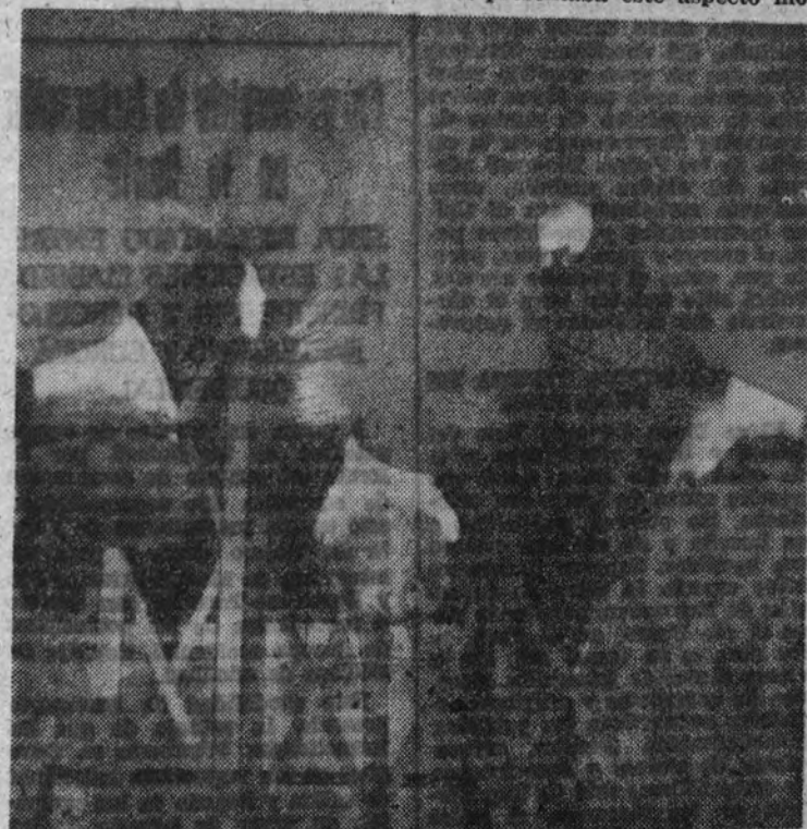
La gran cantidad de agua caída sobre la capital inundó diversas estaciones del Metro. El servicio de éste tuvo que ser interrumpido y cerradas varias estaciones por encontrarse totalmente anegadas

mentos—; de éstas fueron atendidas, por su urgencia y necesidad absoluta, ciento cincuenta, para lo que fue menester movilizar todos los parques, todos los hombres y todo el material disponible.