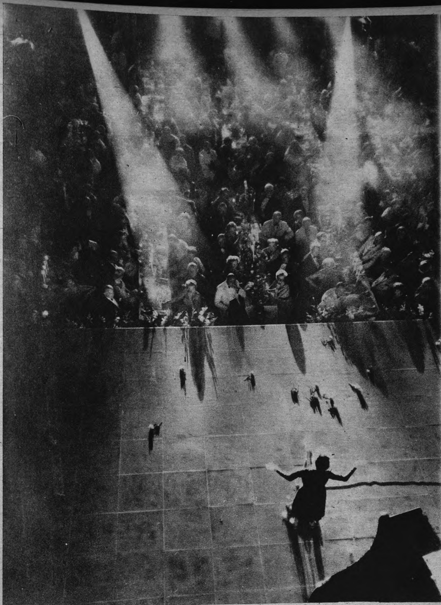
EDITH PIAF. EN LA COSTA AZUL.—Una lluvia de flores saludó a Edith Piaf al concluir su recital en el Sporting Club de Montecarlo, donde se ha presentado por primera vez, después de su reciente enfermedad en los Estados Unidos. Personalidades del cine, de las finanzas, gentes célebres y una vez más volvió a seducir a todos. Entre los asistentes, en las fotografías de abajo, Liz Taylor y Eddie Fisher, a la izquierda, y Gary Cooper y Onassis, a la derecha.