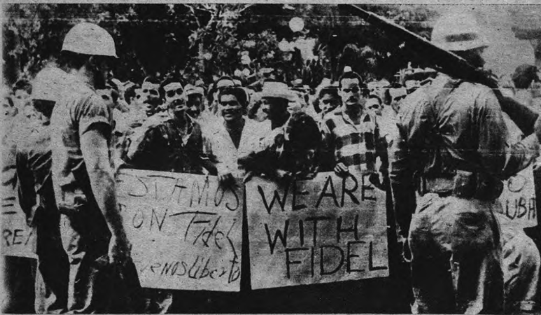
«ESTAMOS CON FIDEL». —Así dicen las pancartas que los entusiastas de Fidel Castro han paseado por las calles de La Habana ante el anuncio de la dimisión del jefe del Gobierno. La concentración ante el Palacio.