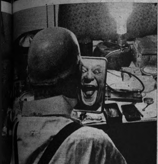
errado el payaso Grook. Era su última apariencia. Pero nitivo a la eternidad. Se había pasado la vida ensa- da en sus actuaciones era una especie de muerte para fin- mular sentimientos para aparentar lo que el público le vido a su intimidad.