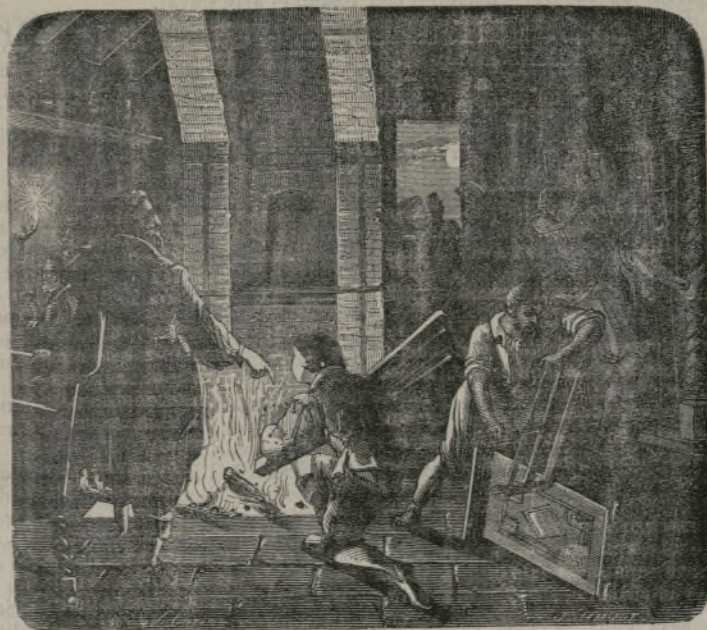
Palissy quema sus muebles para acabar su experimento.

obteniendo excelentes productos. Sus platos fueron pronto uno de los objetos de lujo que los nobles se disputaban. El duque de Montmorency, maravillado ante algunas obras de arte que le fueron presentadas, llamó al artífice y le tomó bajo su protección. Esta protección le libró de la muerte, pues fué condenado á pena capital en Burdeos por haber abrazado la religión reformada.