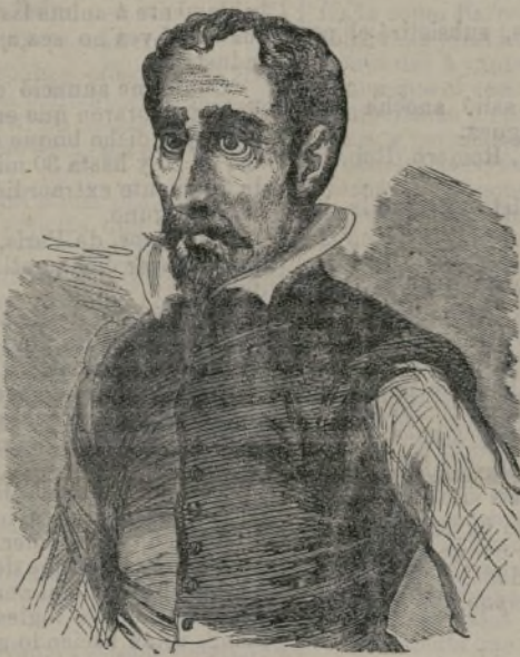
BERNARDO DE PALISSY

Repito, querido Doctor, que esta es opinión mía, exclusivamente mía, sin apoyo de lecciones ni de autoridades, que ni tiempo tengo para consultar; pero bueno fuera que usted y los amigos ilustrados que tiene estudiaran el asunto y vieran si debemos de-