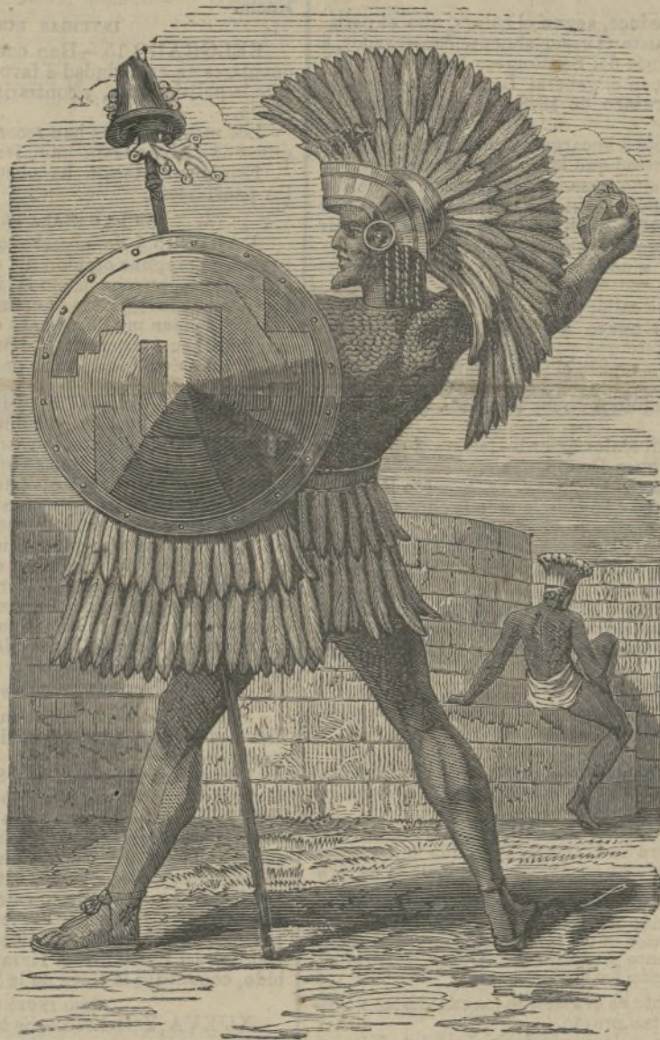
Indios de Tabasco.

Entonces aquel hombre valeroso reunió todo el vigor de sus pulmones, y volviendo el rostro á donde estaban los nuestros, gritó: