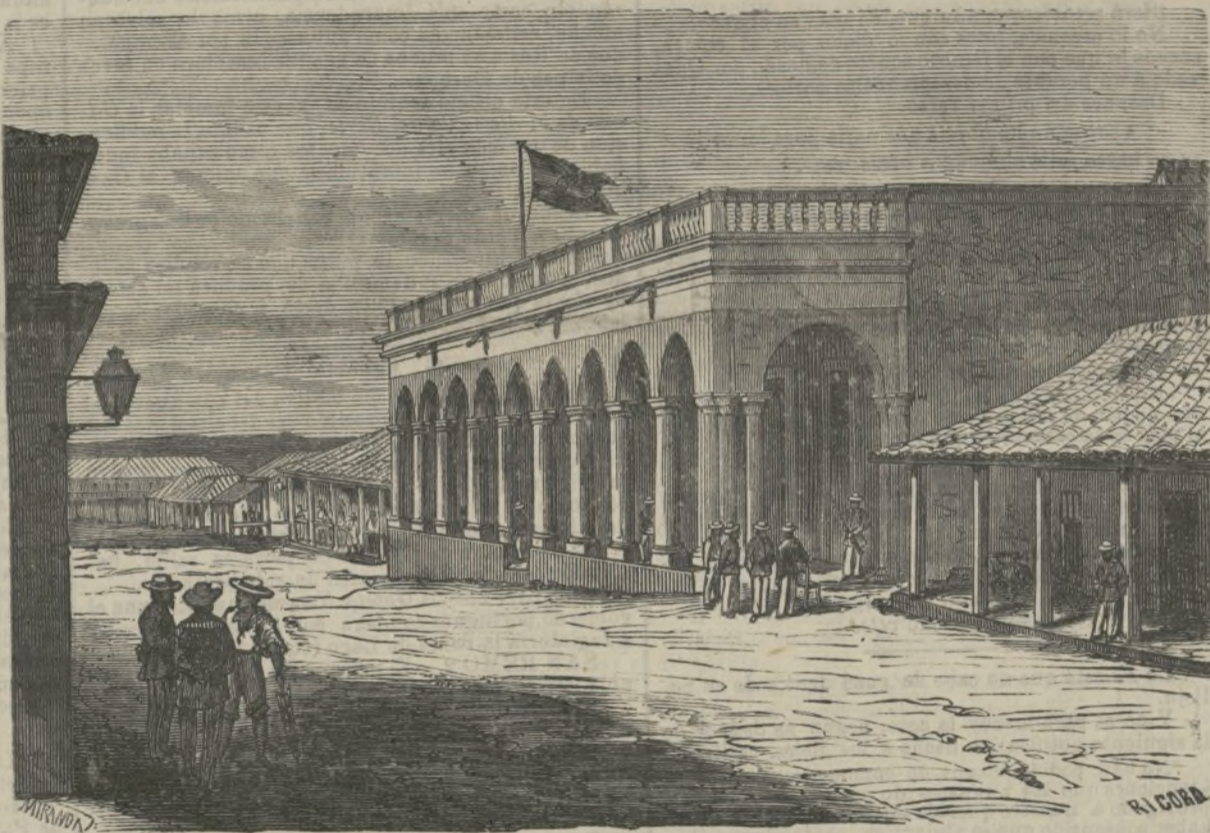
Cárcel pública de Pinar del Río.

En las consultas era brillantísimo. ¡Que conocimientos desplegaba sobre el atero en sus manifestaciones en los vasos! ¡Que práctica tan profunda en los huesos, vísceras y músculos, y la fletitis de las venas, y sobre todo en las partes del cerebro, en su hueso esfenoidal, y en las encefalitis de las membranas aracnoides y meninges! Su facundia verdaderamente era maravillosa, y con su ilustración y conocimientos llevaba siempre el convencimiento á todos sus compañeros de consulta, y á los interesados de la familia del enfermo.