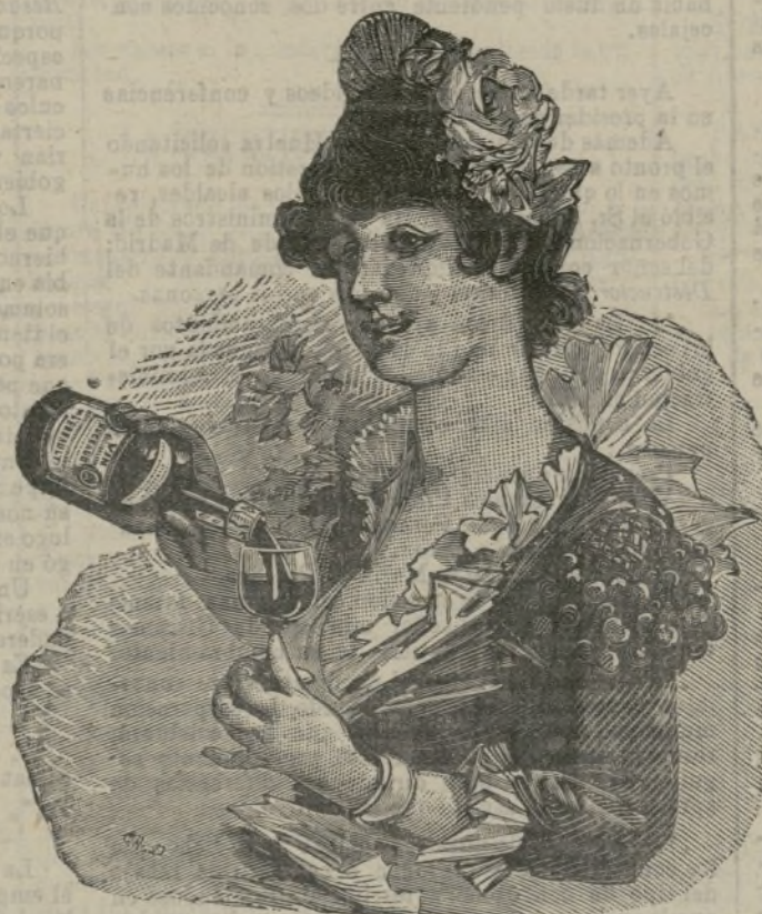
El VINO de BUGEAUD ha obtenido la recompensa más alta en la Exposición de Higiene de la Infancia de Paris (1887)

P. LEBEAULT & C ia , 5, Rue Bourg-l'Abbé, PARIS