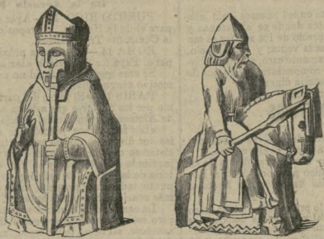
Alfil y caballo del Museo Británico.

Tomando por base la estadística publicada en 1873, España contaba: