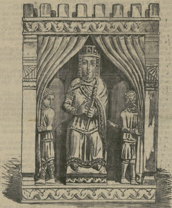
Rey del ajedrez de Carlo Magno.

Un sabio ha encontrado y podido descifrar una inscripción en honor del rey Tutmosis III, que contiene más de 400 nombres geográficos referentes á la Arabia, Armenia, Nubia, y costa del Mediterráneo. Esta inscripción cuenta más de 35 siglos de existencia.