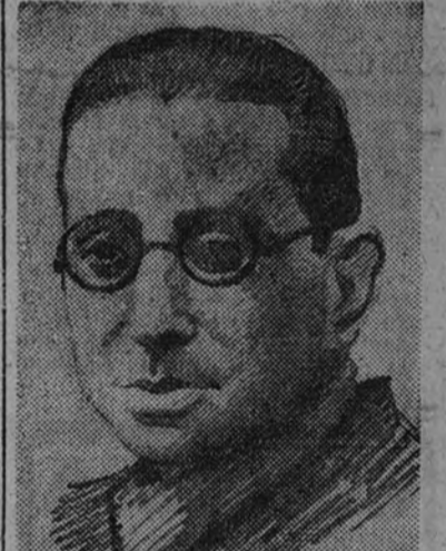
N. de la R. — Gonzalo Torrente Ballester

Ballester nació en El Ferrol en 1910. Cursó el Bachillerato en La Coruña, y más adelante las carreras de Derecho y Filosofía y Letras en las Universidades de Oviedo, Madrid y Santiago de Compostela, licenciándose en esta última con premio extraordinario. En 1936 ganó por oposición la Auxiliaría de Historia de la Edad Antigua en la última de dichas Universidades, siendo pensionado para ampliar estudios en la Sorbona. Encontrándose en París estalló el Movimiento Nacional, reintegrándose a España, donde inmediatamente se incorporó a las tareas de la Falange, en la que ocupó cargos de jefe de la Red Sindical Española Universitario, Jefe de Propaganda y, finalmente, dirigió una sección del Departamento de Ediciones en el Ministerio de Educación. Terminada la contienda se reintegró a sus tareas universitarias, ganando en 1940 una cátedra de Lengua y Literatura de Institutos, cuyo ejercicio simultáneo con el de auxiliar universitario hasta 1942, en que fue destinado al El Ferrol del Caudillo, de cuyo Instituto fue director. En enero de 1947 fue nombrado profesor de Historia General de la Escuela de Guerra Naval de Madrid, puesto en el que continúa. Está condecorado con la Cruz del Mérito Naval de segunda clase.