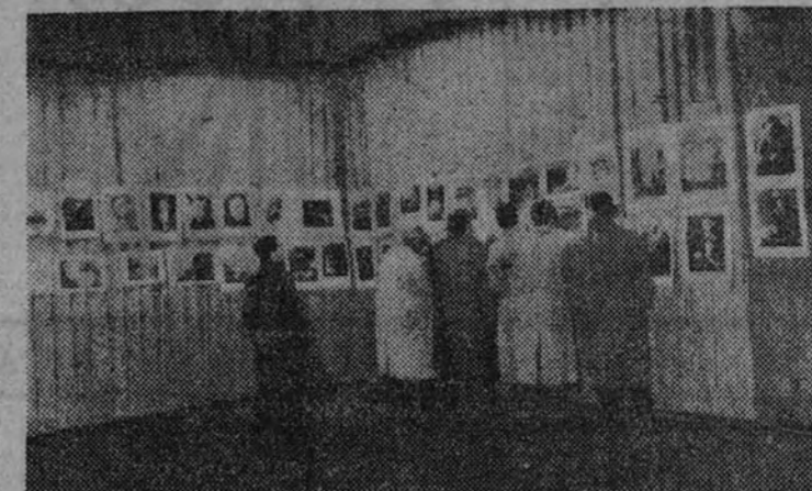
Los españoles no será ahora sino la confirmación de los que ya han alcanzado en más de docenas Exposiciones de esta clase a las que concurrieron en diversos países de Europa y América, en China, en la India, en Australia y en Nueva Zelanda.

EN el Circulo de Bellas Artes se inauguró ayer tarde el XVI Salón Internacional de Fotografías, con asistencia de autoridades y directivos de la Real Sociedad Fotográfica de Madrid, organizadora del certamen. A esta Exposición, que desde ayer está abierta al público, concurrirán más de 299 fotografías aficionados, con cerca de mil fotografías, y entre las cuales hay algunas enviadas desde Checoslovaquia y Yugoslavia. Puede decirse que en el recinto de la Exposición figuran los más bellos parajes del mundo. Por parte de España hay trabajos de los doscientos miembros de la Sociedad Fotográfica, que han recorrido todas nuestras regiones para tomar con sus cámaras los mejores paisajes y cuanto de artístico y monumental ofrece cada una de ellas. Puede decirse que el éxito de los representantes