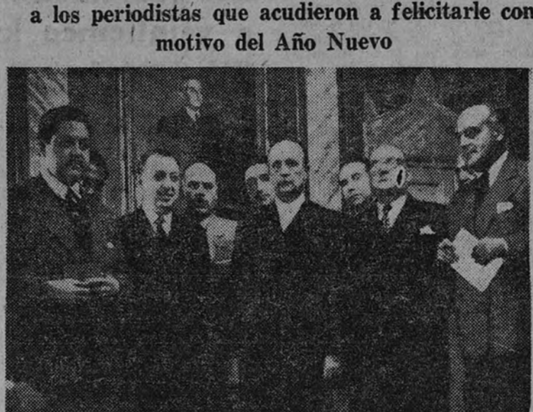
El Ministro de Justicia y Secretario General del Movimiento, camarada Fernández-Cuesta, con los periodistas que le felicitaron con ocasión del nuevo año.

Manifestaciones de Raimundo Fernández-Cuesta a los periodistas que acudieron a felicitarle con motivo del Año Nuevo