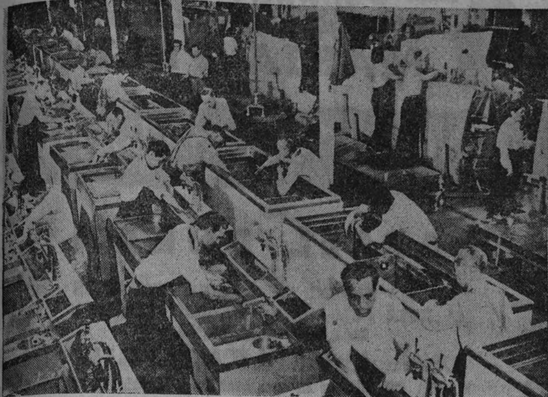
Alas de avión al fondo y neveras en primer término. La guerra y la paz. Las líneas paralelas que hoy sirven de base al tinglado de todas las conversaciones. He las aquí juntas, en el país que se queda sin dioses, bajo el sello de los hombres "standards" que soñó Jefferson.

No me gustan las generalizaciones. Pero si me las pidieran sobre los países que conozco, diría que Francia es la medida; España, la profundidad; Holanda, el trabajo; Bélgica, el hogar; Inglaterra, la tradición; Estados Unidos, el poder. Por esto, el peligro para Francia es la medida; para España, el aislamiento; para Holanda, la historia; para Inglaterra, el aislamiento; para Estados Unidos, el peligro: creerse que les basta el poder; creerse que lo tienen asegurado.