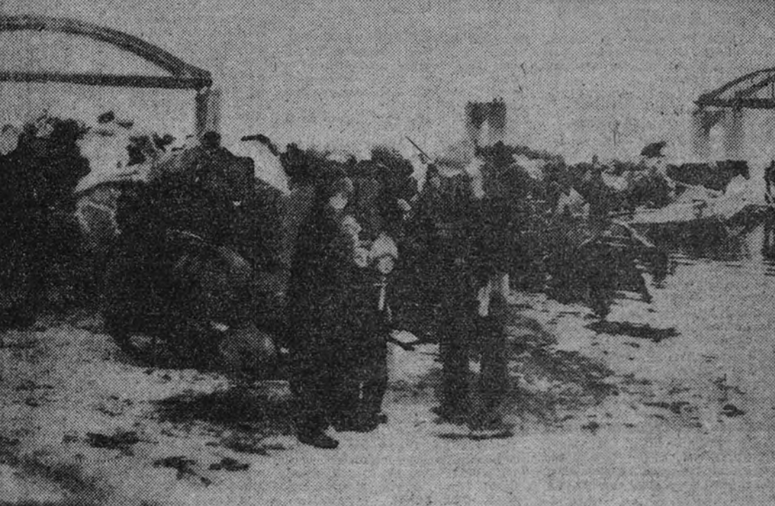
Bajo una cruda temperatura estas infelices familias surcoreanas de Seúl esperan el momento de cruzar el río Han, hacia el Sur, huyendo del avance rojo.