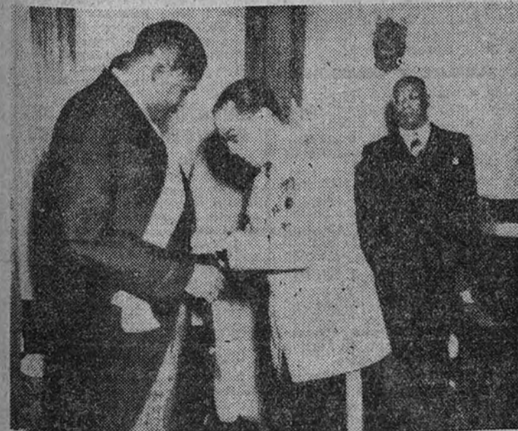
El embajador extraordinario de España, señor Vidal y Sauras, en el momento de imponer la Gran Cruz de Isabel la Católica al Presidente de la República de Haití, coronel Paul Eugène Magloire.