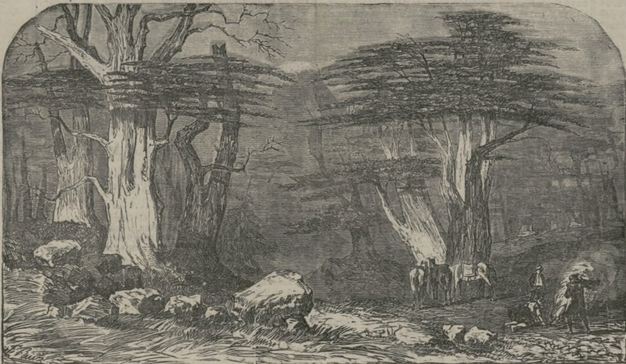
Los Cedros del Líbano.

Si, al contrario, se encuentra un filon metálico entre las estacas, la resistencia del circuito se debilita y la campanilla funciona.