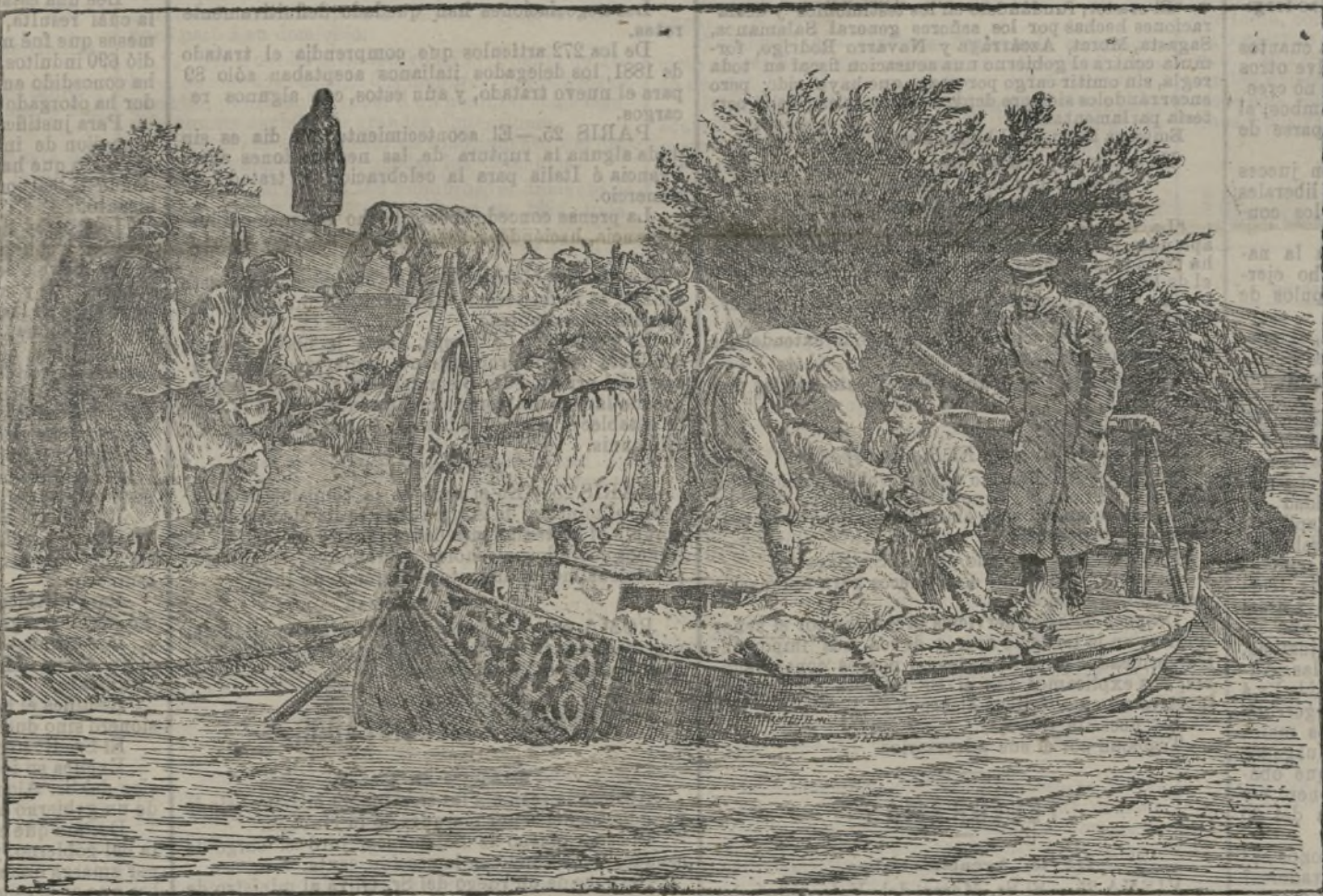
El contrabando de armas en Rumania.

De los experimentos hechos para conocer las causas de la decoloración del papel, resulta que la acción de la luz eléctrica sobre las sustancias vegetales como el lino, algodón, paja, etc., es grande, así como sobre el tanino de las tintas que se vuelven amarillentas por oxidación.