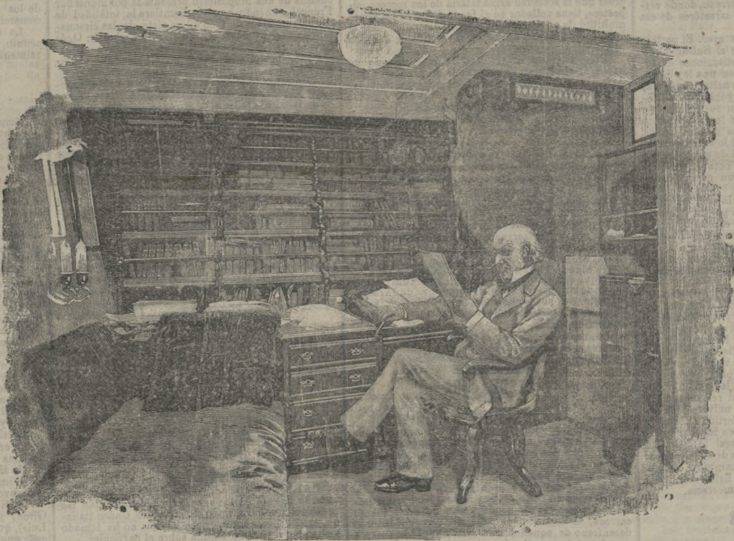
Mr. Gladstone a bordo del Sunbeam .

Con motivo de un duelo verificado en París se ha hecho una observación muy importante. Los dos adversarios se atravesaron mutuamente el pulmón y uno de ellos fué herido con tal violencia que la punta del arma de su contrario le asomó por la espalda, y sin embargo, ambos combatientes han podido volver completamente curados a atender a sus ocupaciones habituales al cabo de algunos días, no habiendo sobrevenido la menor complicación. Tan feliz resultado se debe, según parece, a la juiciosa precaución tomada por el médico que asistió al combate, de meter en ácido fénico las espaldas antes de ponerlas en manos de los adversarios a imitación de lo que se practica en otras partes y particularmente en Hungría.