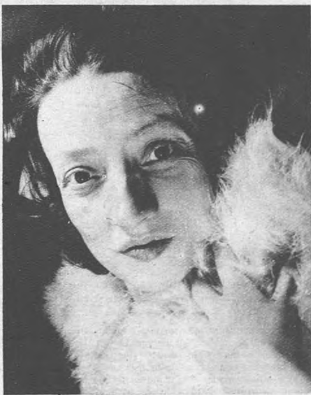
ARRUGAS DE VICTORIA. —En los últimos días de ayuno madame ha adelgazado extraordinariamente. Las arrugas de la cara se le han acentuado, pero el deseo de derrotar al faquir puede más que la coquetería