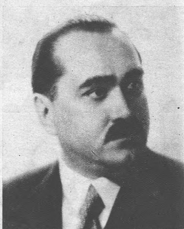
KAROL SIDOR, PRESIDENTE DEL CONSEJO NACIONAL ESLOVACO EN EL EXTRANJERO. —«Queremos reconstruir el nuevo Estado eslovaco sobre principios de democráticos, conservando todo lo bueno y permanente que se ha conseguido en la vida nacional independiente y en la política interior.»

ARRIBA saluda hoy a la Eslovaquia prisionera, renovando en el aniversario de su proclamación nacional los votos más sinceros y fervientes porque este pueblo recobre pronto su rango entre las naciones libres y cristianas. Dios proteja a Eslovaquia.