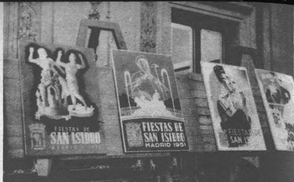
PARA LAS FIESTAS DE SAN ISIDRO Como es tradicional, en el Patio de Cristales de la Casa de la Villa se exhiben los carteles que participan en el Concurso convocado por el Ayuntamiento para seleccionar el mejor original para anunciar las fiestas.