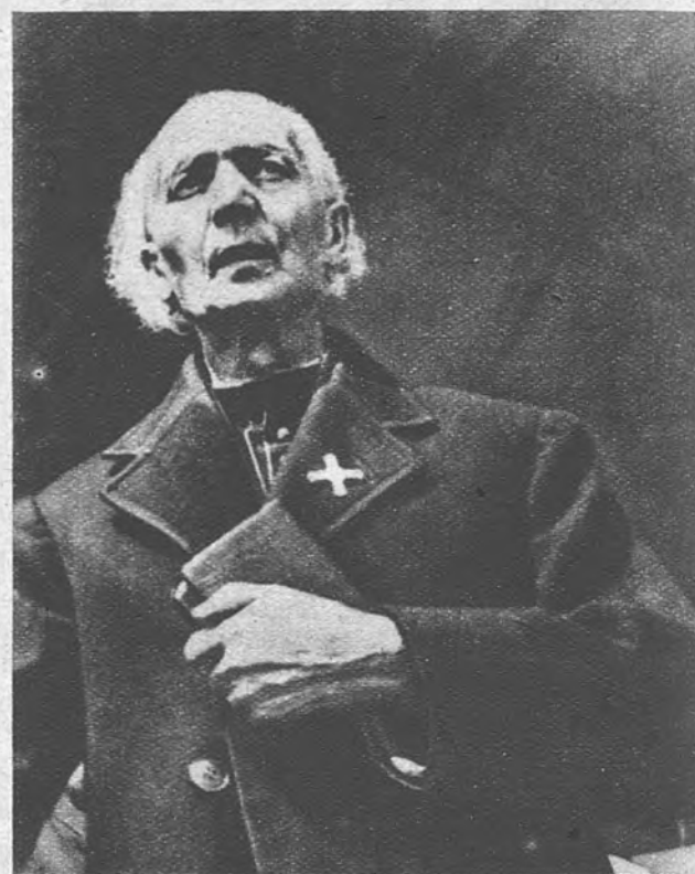
EL PADRE DE LA INDEPENDENCIA ESLOVACA. —Andrea Hlinka, párroco de Ruzomberok, luchó toda su vida para obtener del Gobierno checo la independencia de Eslovaquia. Murió en 1938, en vísperas del triunfo de sus ideales

Hoy, bajo el yugo soviético, celebra Eslovaquia su Fiesta Nacional