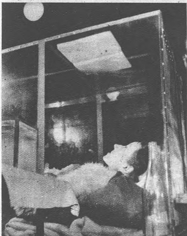
LITERATURA DE CIRCUNSTANCIAS. —Como el que no se consuela es porque no quiere, la ayunadora francesa dedica todas las noches un rato a la lectura de libros de Gandhi. Un ayudante le pasa las páginas del libro.