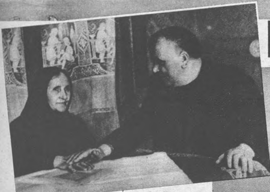
EL HOGAR DEL MARTIR. —Cuando la cuerda del verdugo se ciñó sobre el inocente cuello del sacerdote eslovaco y Presidente de la República, monseñor Tisso, un viejo rosario se desprendió de sus manos en el último trance. Era el rosario campesino de su anciana madre, a quien vemos en la fotografía