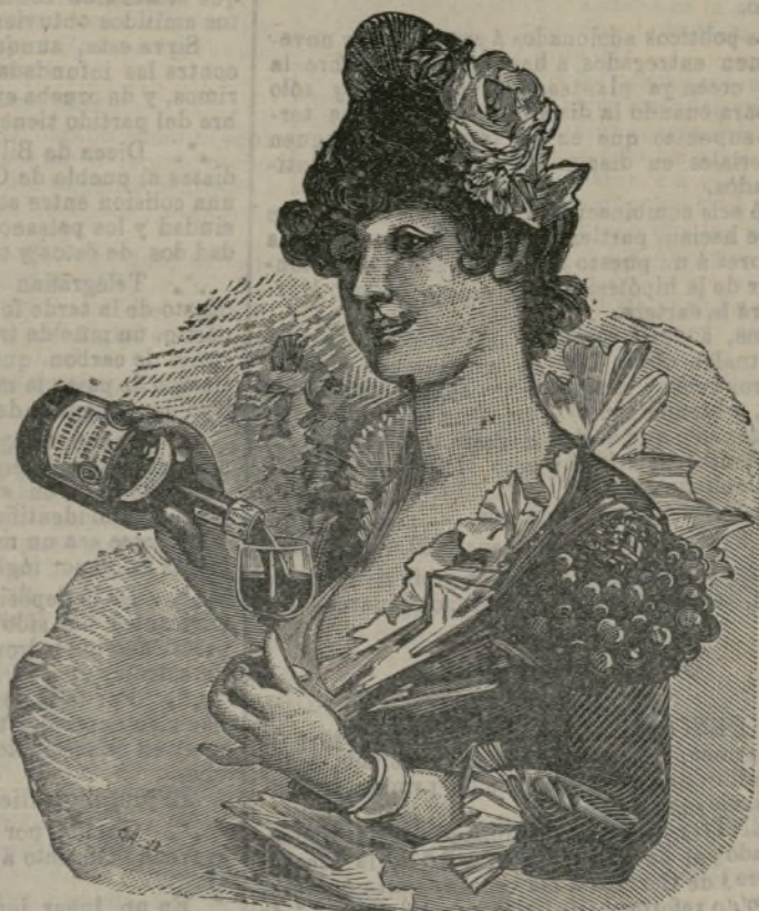
El VINO de BUGEAUD ha obtenido la recompensa más alta en la Exposición de Higiene de la Infancia de Paris (1887)

P. LEBEAULT & C.ª, 5, Rue Bourg-l'Abbé, PARIS