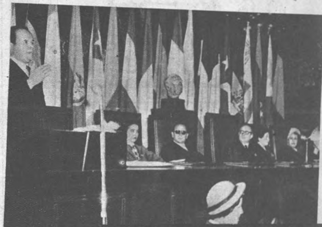
I CONGRESO FEMENINO HISPANOAMERICANO En la mañana de ayer, y en el salón de actos del Consejo de Investigaciones, se celebró la sesión inaugural de este Congreso, con la asistencia del Ministro de Educación Nacional, el Vicesecretario de Secciones, la Delegada Nacional de la Sección Femenina y distinguidas personalidades extranjeras.