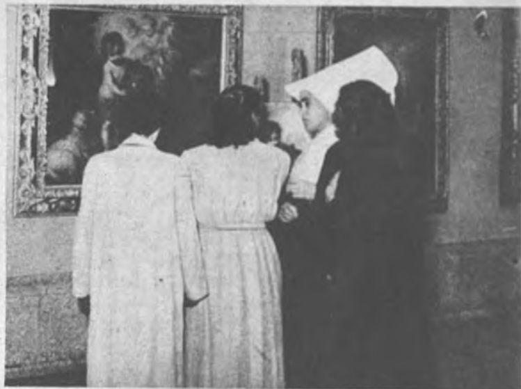
LA TERNURA DE MURILLO. —Aparte de la admiración general que sus cuadros producen, Murillo tiene un público especial, que va al Museo solamente para extasiarse ante la infinita ternura de sus Vírgenes y sus Niños

nebra a base de los dos mil cuadros que de la pinacoteca se llevaron los rojos y que poco antes de la guerra mundial volvieron a Madrid merced a las gestiones de Franco y del general Beigbeder, calurosamente apoyados por el mariscal Petain.