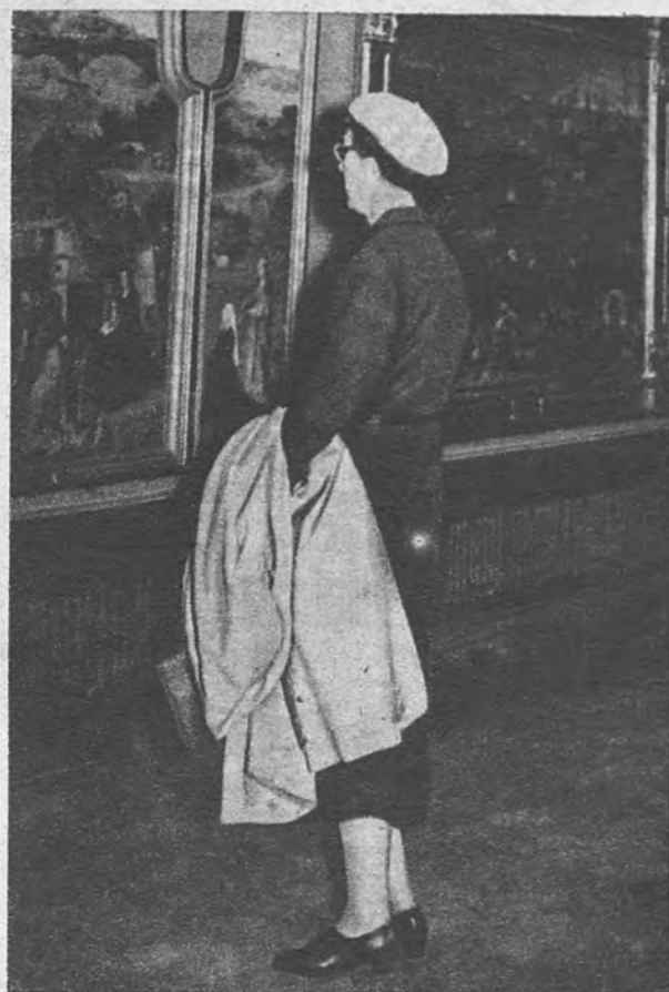
VISITANTE DE UNIFORME. —La expresión popular de «va vestida de extranjera» es bastante acertada. En las salas del Museo del Prado se aprecia bastante bien y frecuentemente todo el amplio sentido definitorio de esta frase