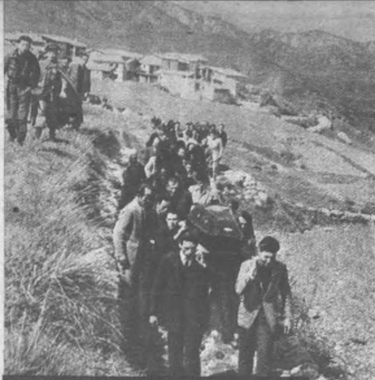
LA CATASTROFE DE BERGA Este es el último acto: por una ladera campesina son conducidos al cementerio los cadáveres de los obreros que perecieron a consecuencia del derrumbamiento de cien metros de galería. Presidió el fúnebre acto el Gobernador y Jefe Provincial de Barcelona.