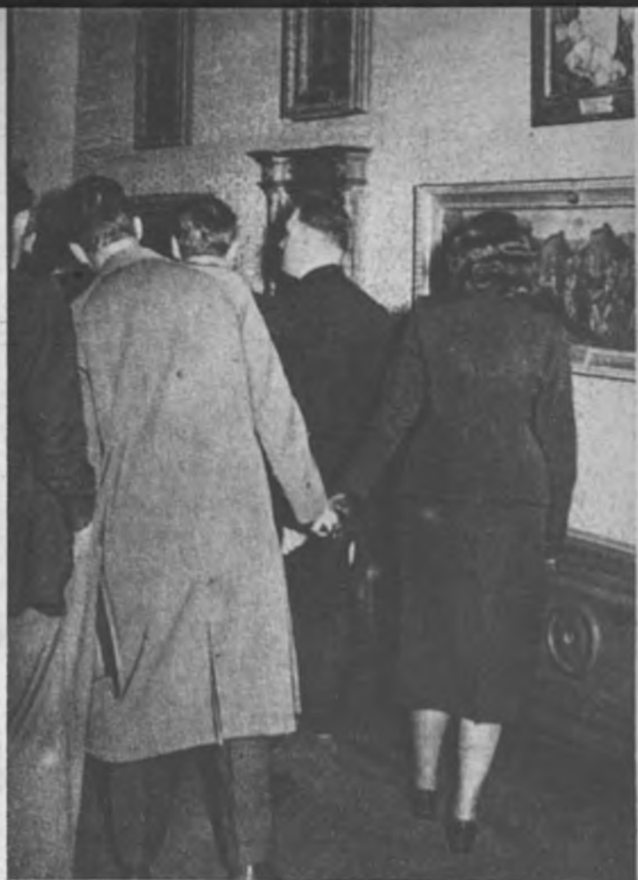
ARTE Y AMOR. —La parejita que ha venido a España en luna de miel se ha unido a un grupo de turistas, y se esfuerza para no perder un solo detalle de la explicación del guía

ESTAMPAS A LA SALIDA. —La visita final obligada es a los puestos donde pueden adquirirse tarjetas y catálogos. También pueden comprarse libros biográficos del pintor que más ha impresionado