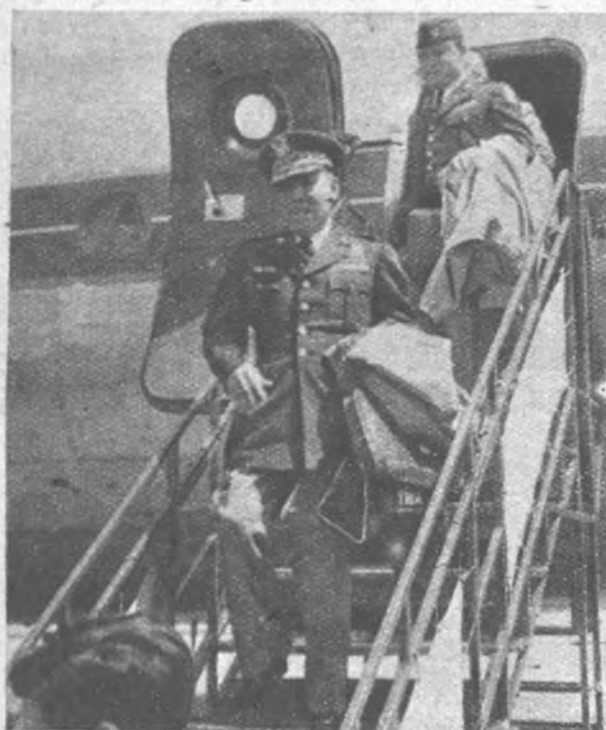
GENERAL EN JEFE DEL EJERCITO FILIPINO Llegó por el aeropuerto de Barajas el general don Mariano N. Castañeda, jefe del Alto Estado Mayor filipino. Es uno de los militares más distinguidos de su país, y su nombre va asociado a la epopeya de Bataan. Prisionero de los japoneses, sobrevivió a la «marcha de la muerte».