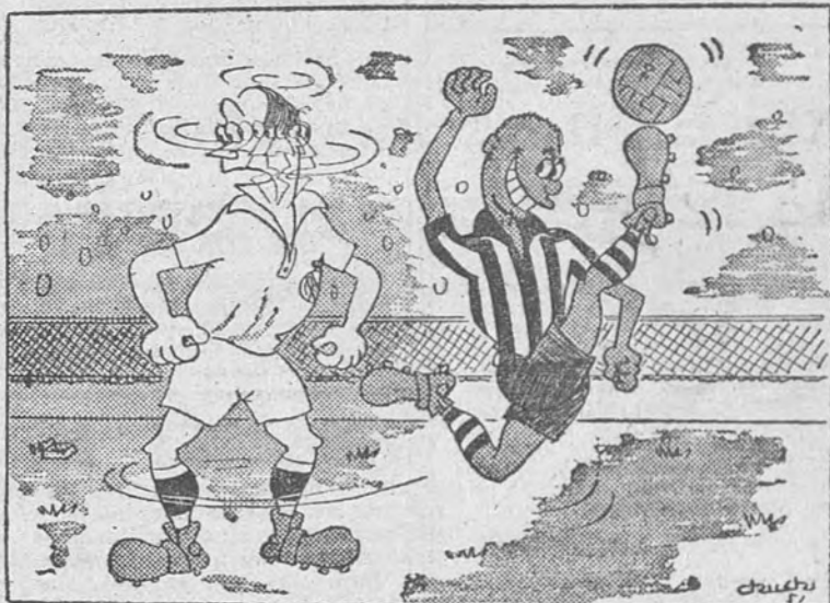
CONTAGIO EN CHAMARTÍN, por "Chuchi" —¡Caramba! ¡Este extremo me está poniendo negro!

El campeón mundial no pondrá en juego su título