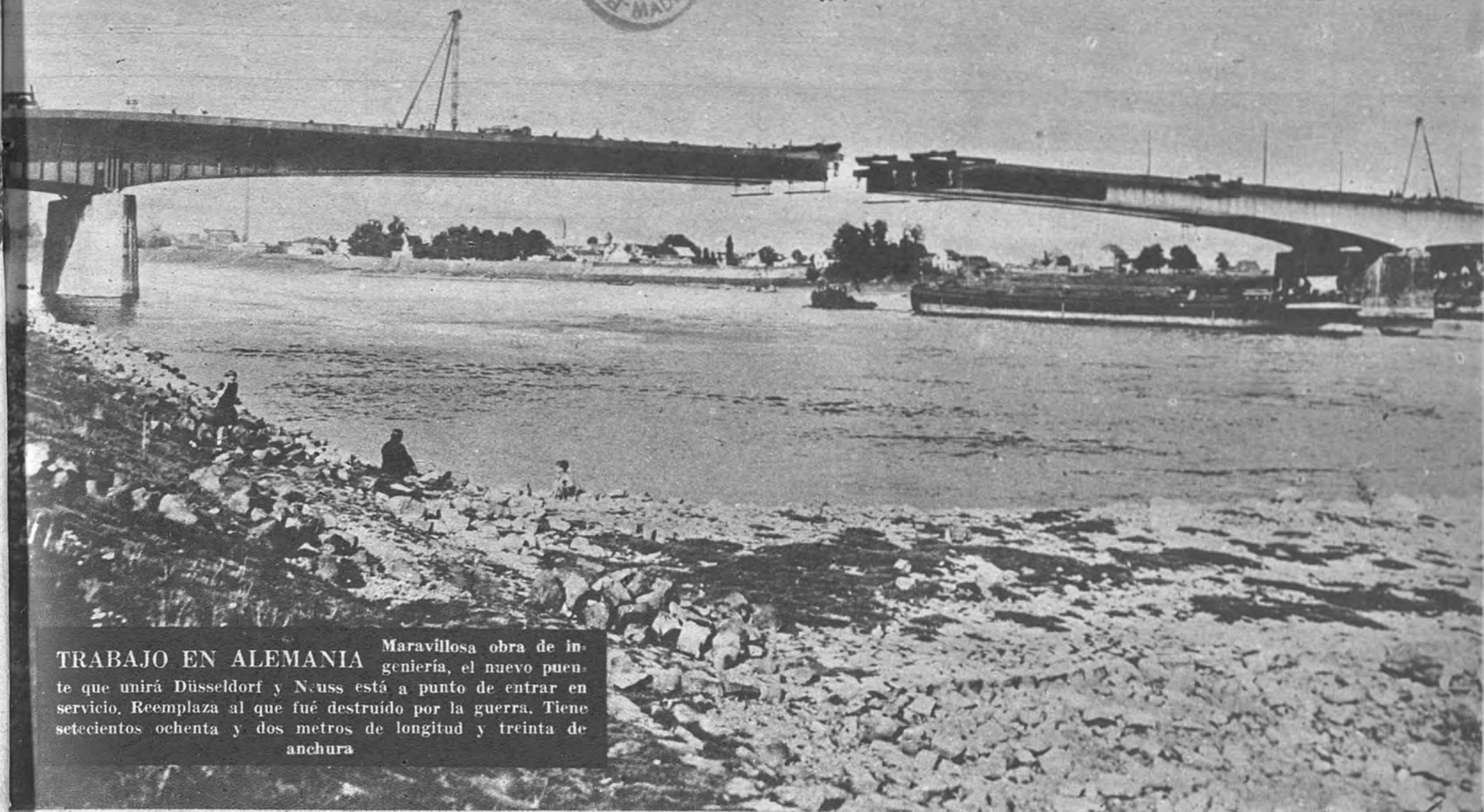
TRABAJO EN ALEMANIA Maravillosa obra de ingeniería, el nuevo puente que unirá Düsseldorf y Neuss está a punto de entrar en servicio. Reemplaza al que fué destruido por la guerra. Tiene setecientos ochenta y dos metros de longitud y treinta de anchura