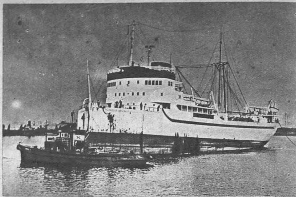
CON PROA PROVISIONAL. —Este es el «Christer Salen», barco sueco de cinco mil toneladas. Fue azotado por un tifón frente a la costa japonesa y sufrió, en consecuencia, graves daños. Para llegar al puerto de Bremen (Alemania) hubo que adaptarle una proa provisional