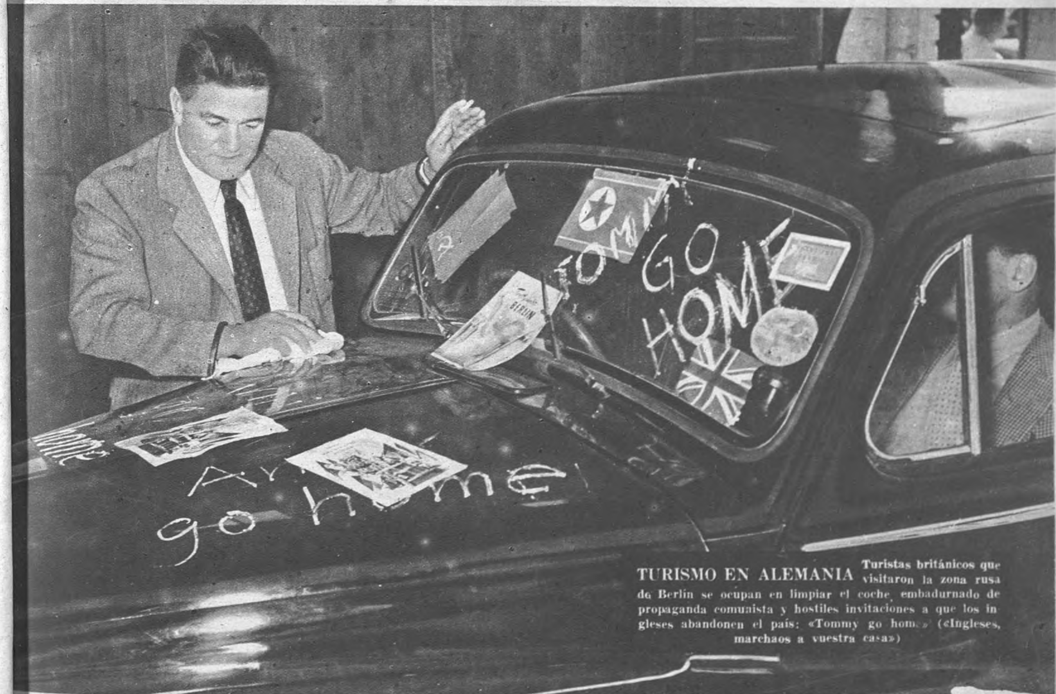
TURISMO EN ALEMANIA Turistas británicos que visitaron la zona rusa de Berlín se ocupan en limpiar el coche, embadurnado de propaganda comunista y hostiles invitaciones a que los ingleses abandonen el país: «Tommy go home» («Ingleses, marchaos a vuestra casa»)