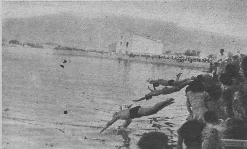
Participantes del campeonato de natación celebrado el día de la bendición del estanque toman la salida para una de las pruebas, mientras los habitantes contemplan por primera vez, con cierto asombro, esta prueba deportiva