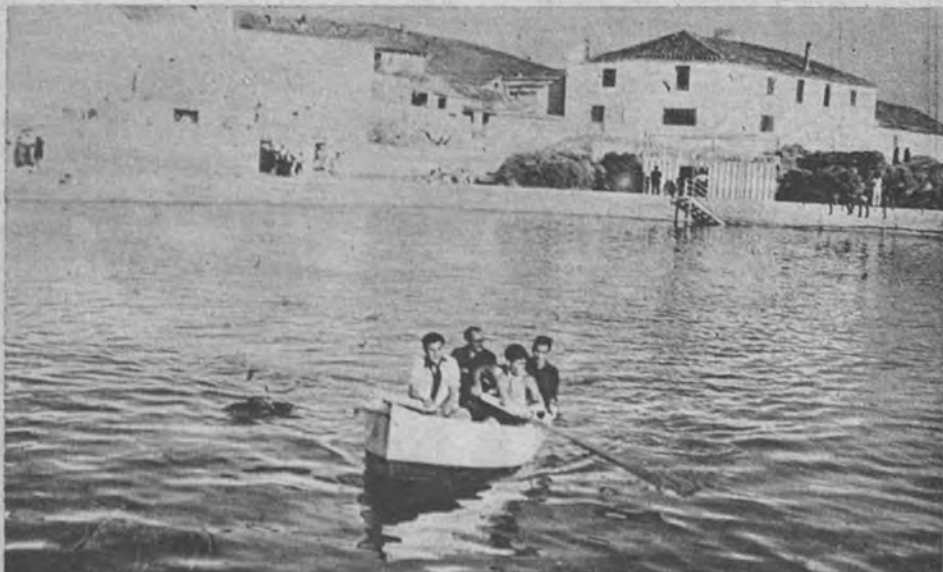
Una de las lanchas botadas el día de la inauguración del estanque da su primer paseo, llevando a miembros del Frente de Juventudes de Jaén como tripulantes y pasajeros. Al fondo, la caseta de baño y el trampolín-escalera