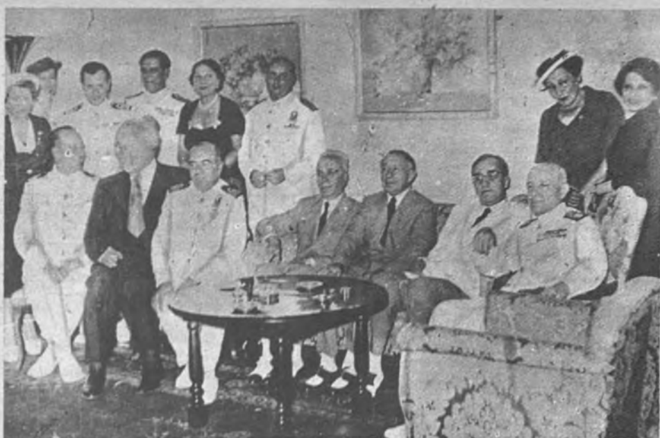
EL «ELCANO», EN ATENAS. —De la recepción dada en la Legación de España en Atenas en honor de los oficiales y guardiamarinas del «Juan Sebastián Elcano». Sentados en el centro; el Ministro de Marina, el Ministro de España y el Ministro de Asuntos Exteriores