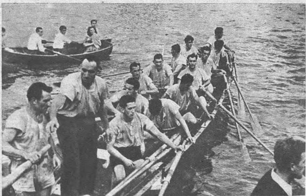
CAMPEONES DE ESPAÑA. —Los remeros de la trainera de Orio reflejan en sus semblantes el esfuerzo realizado durante la regata de la ría de Portugalete, en la que se proclamaron campeones de España de esta especialidad. En segundo lugar se clasificó la trainera de Avilés

ARRIBA. —Madrid, miércoles 19 de septiembre de 1951