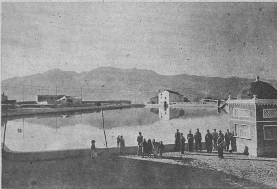
Vista de la famosa Charca recién terminadas las obras. Sobre sus tranquilas aguas se reflejan las montañas que aparecen al fondo, mientras un grupo de vecinos posan para «retratarse»

En esta magnífica fotografía se aprecia más extensamente la Charca. Al fondo, las montañas en cuyo subsuelo tiene su origen el manantial, y rodeando el estanque, las edificaciones del pueblo. Casi en el vértice de los lados del rectángulo que forma el estanque puede apreciarse el desagüe. La fuente está, precisamente, detrás del kiosco que aparece al fondo