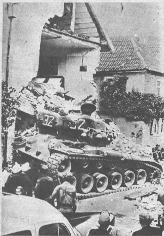
UN RESBALON, CUALQUIERA DA. —El tanque regresaba de unas maniobras en Goshheim (Baviera) y, según dice la agencia informadora, «resbaló» en la carretera. Resumen: casa destruida y mujer lesionada