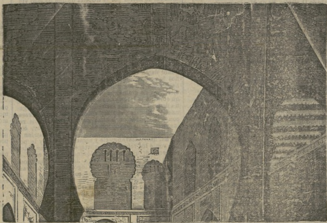
Casa de los Consejos en Tetuan.

Cuando se está de estos árboles gigantes, es cuando se experimenta la impresión que producen sus enormes dimensiones.