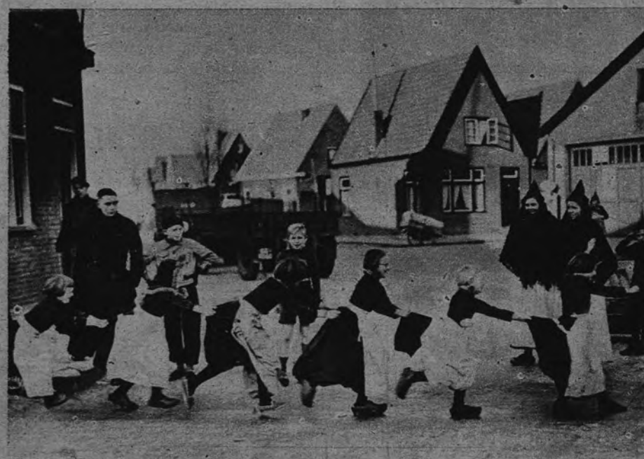
ENTRENAMIENTO PARA EL INVIERNO. —Las aguas de los canales holandeses de Volendam aun no están heladas, y, por tanto, no permiten la práctica del patinaje. En espera de las bajas temperaturas, los chiquillos se entrenan sobre el pavimento de las calles.