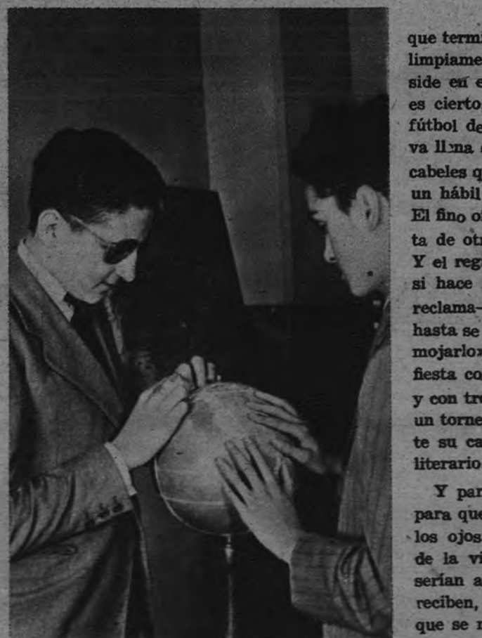
En este globo terráqueo en relieve los alumnos se familiarizan con los contornos, los valles y los paralelos