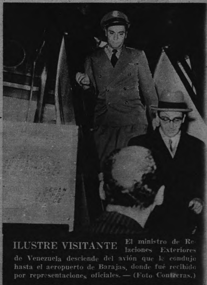
ILUSTRE VISITANTE El ministro de Relaciones Exteriores de Venezuela desciende del avión que le condujo hasta el aeropuerto de Barajas, donde fue recibido por representaciones oficiales.