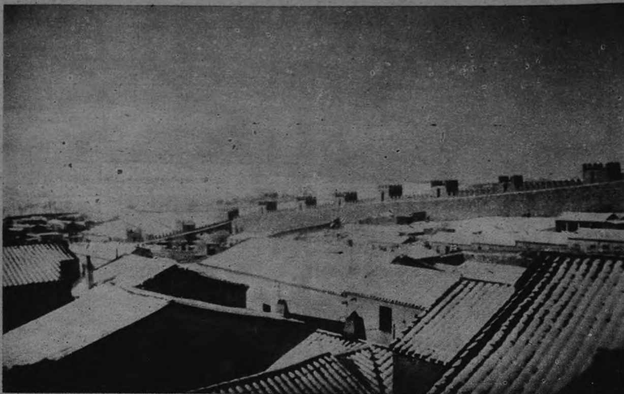
LA PRIMERA NEVADA DEL AÑO EN AVILA. —El paisaje de la ciudad de Avila, con su inconfundible perfil de murallas, inaugura el invierno bajo la primera nevada de la temporada.