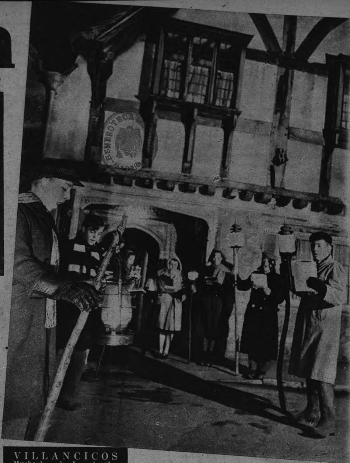
VILLANCICOS Muchachos de Lacock (Inglaterra) cantan villancicos ante una casa del tiempo de los Tudor. Se alumbran con faroles exactamente iguales a los de la época que representa el edificio