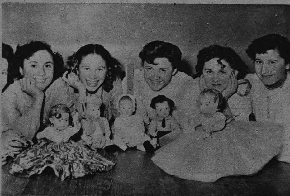
MUÑECAS DE CHRISTIAN DIOR. —Con destino a un festival benéfico, las costureras de Dior han vestido a sus muñecas con reproducciones de los modelos de la casa. Estas muñecas serán uno de los obsequios, entre los muchos regalos, que se ofrecen a los participantes en la fiesta.