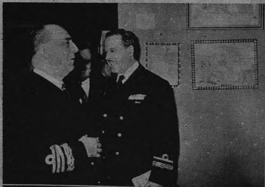
EXPOSICION DE PINTURAS DE MARINOS. —El Ministro de Marina, almirante Moreno, acompañado de diversas personalidades, asiste al acto de apertura de la Exposición de Pinturas de Marineros, que se celebra actualmente en el Museo Naval de Madrid.

ARRIBA. —Madrid, sábado 22 de diciembre de 1951