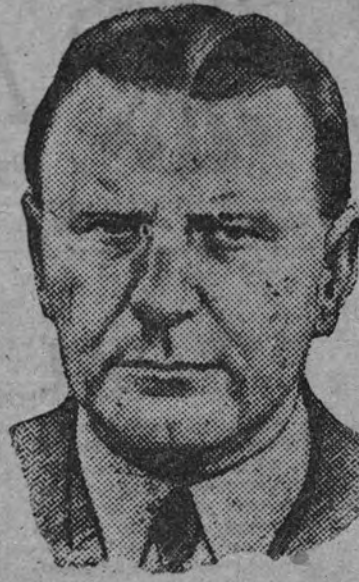
Don Manuel Aznar, nuevo embajador de España en Buenos Aires

Ha ocupado altos cargos, y entre ellos la Jefatura Provincial de Ma-