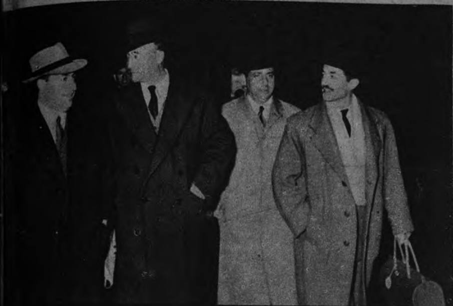
NAVIDAD, EN ESPAÑA El embajador de España en Londres, duque de Primo de Rivera, llega a Barajas con intención de pasar las fiestas navideñas junto a su familia.