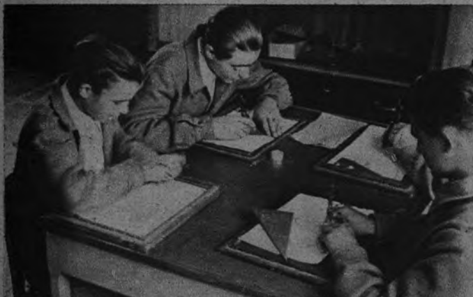
Casi increíble, pero auténticamente cierto. El compás funciona exacto en manos de estos alumnos dibujantes