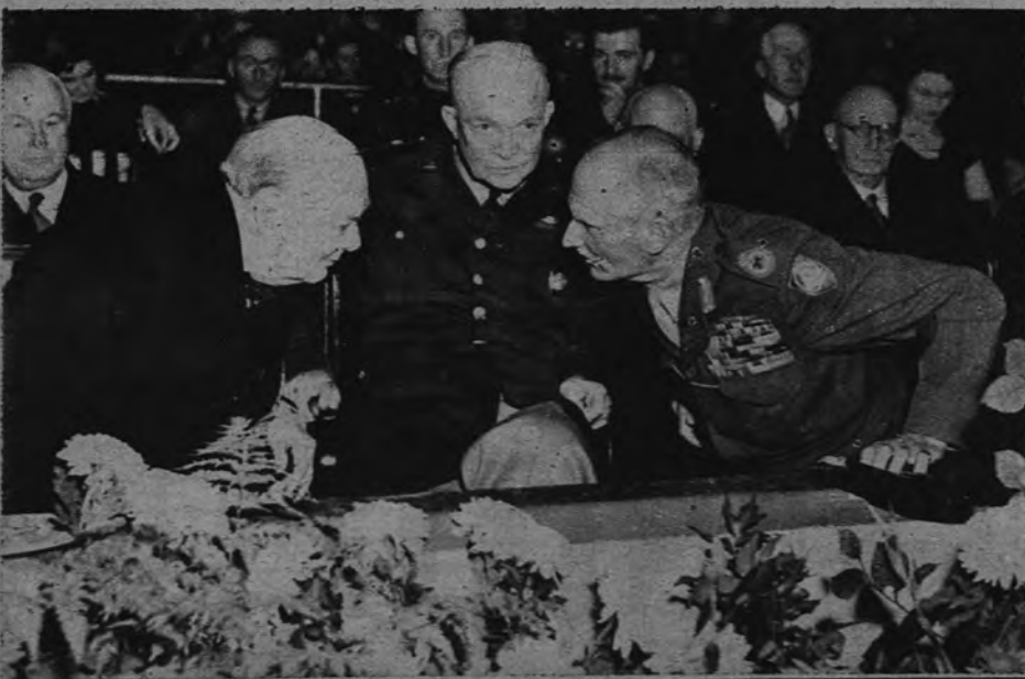
LA «FOTOGRAFIA PERIODISTICA DEL AÑO». —Como tal ha sido seleccionada ésta en el concurso anual de la Enciclopedia Británica. Fué obtenida por Skingley—veintiún años—, repórter de «Planet News», durante la conmemoración de la derrota de Rommel en El Alamein. Churchill, Monty e Ike rememoran en la baranda.