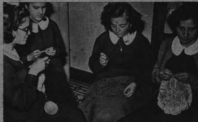
Los más complicados encajes salen de las hábiles manos de estas muchachas del Colegio Nacional de Ciegos