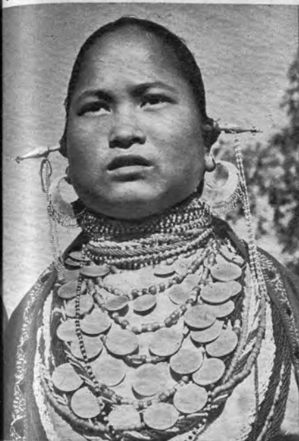
Dominios nor- rafas.)