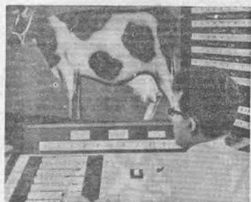
La Asociación Regional de Control de Schleswig-Holstein, el Estado federado más septentrional de la República Federal, ha invertido unos 400.000 marcos (100.000 dólares) en una instalación electrónica de elaboración de datos que, para incrementar la producción de

No tardando, la cría de ganado se basará por vez primera en la República Federal de Alemania en los supuestos rigurosamente científicos. Las fórmulas matemáticas al respecto han sido ideadas por el doctor agrónomo Hans O. Grawert.