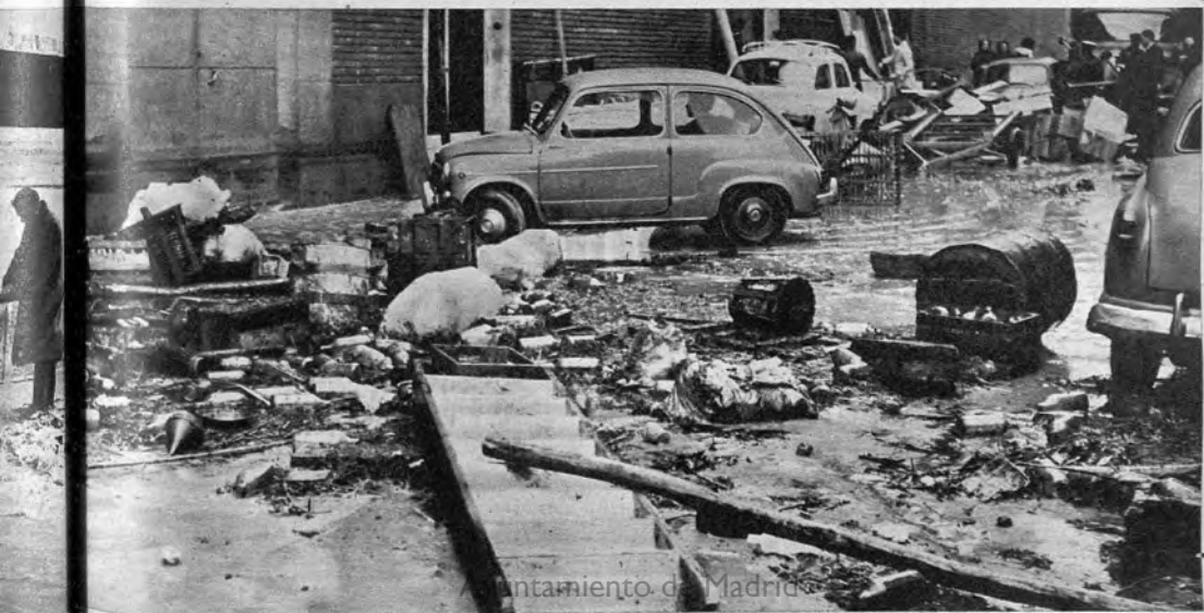
Contaminación de Madrid

las de Legazpi, Cantilleja, Parque Aluche y avenida del Manzanares— fue aprobado por el Ministerio de Obras Públicas hace cinco años y hace poco se actualizó su presupuesto, que asciende a ciento cuarenta millones de pesetas. Sería conveniente saber por qué no se ha construido. Bomberos, fuerzas del Ejército, Guardia Civil y Policía Armada trabajaron en las tareas de salvamento. (Pastor.)