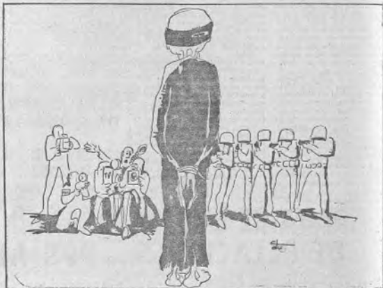
—¿Quiere hacer el favor de moverse un poco hacia su izquierda?

Seminarios Sindicales de Prevención de Riesgos Profesionales en una acción que alcanzó a diecisiete provincias, al tiempo que, bajo el patrocinio del Fomento Nacional de Protección al Trabajo, se realizaron en 1963 23 cursos de divulgación, con asistencia de 3.880 trabajadores, en tanto que en 1965 se han celebrado 100, con asistencia de 4.000 obreros en todas las provincias. Símense otros numerosos cursos a nivel superior de Instructores para mandos intermedios de Empresas, otros de primeros auxilios y socorrismo y la creación de centros pilotos, como el de Medicina Social Agrícola de Cullera, y se tendrá una visión panorámica del esfuerzo que despliega la Organización Sindical en este esfuerzo comunitario de paz en fin, hasta donde sea posible, a los accidentes de trabajo.