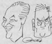
Ray Milland y Don Rickles

el ojo humano tenga el mismo poder que los rayos X en sentido del bien. Pero al probar en el mismo su intención, obsesionado por el éxito, se transforma, en su otro. Y cambia su destino de hombre abnegado, de nobles finalidades, al oponerse por la fuerza, de manera violenta, a su colega y amigo, que intenta disuadirle de que no continúe sus experimentos. Sin ver el autor material de su muerte, toda la culpa es suya. Es su primer delito.