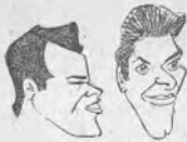
Dirk Bogarde y Georges Chakiris