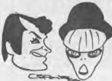
Tony Curtis y Dany Saval

Si no se admiten el convencionalismo y hasta la falsedad de la situación, que se repite, no hay nada que hacer; porque estas películas, que trasladan al cine fielmente obras teatrales pertenecientes al género amable y risueño de la comedia, exigen en el espectador la actitud de creerse cuanto contempla. No de ingenuidad, sino de comprender en seguida lo que se le ofrece.