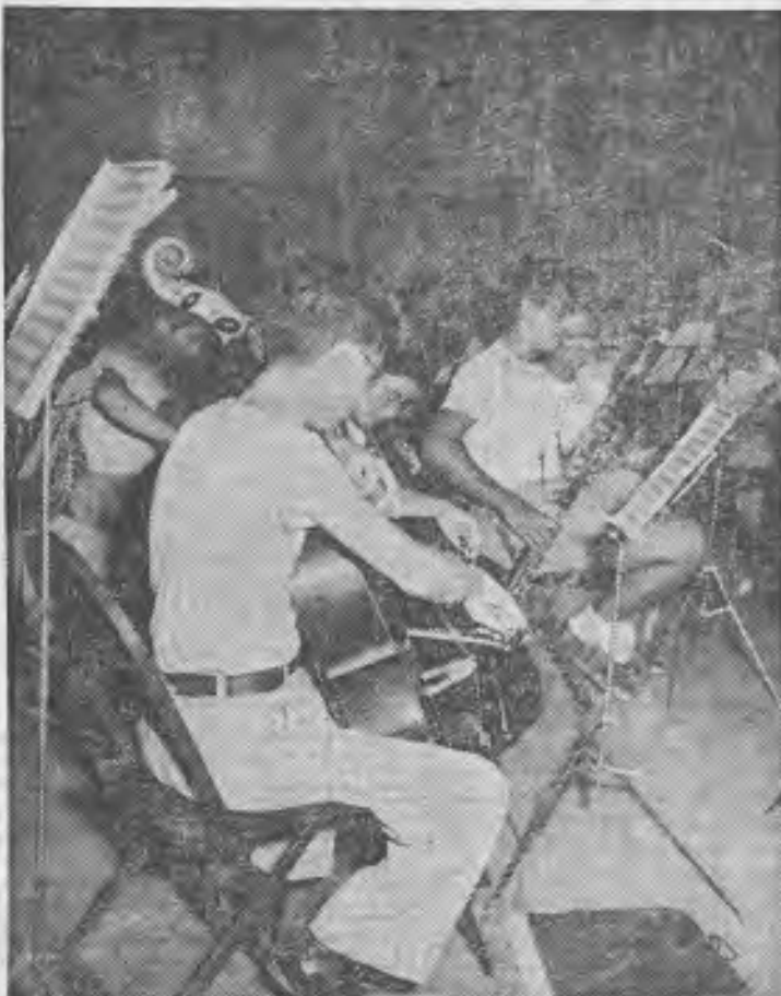
Orquesta sinfónica de los niños de Kibutz

Por haber vivido la experiencia personalmente, podía contestar a todas estas preguntas negativa-