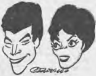
Ray Danton y Pascale Petit

ger Hanin —en el de Stuart— y alemán Charles Regnier, en el de Ríos.