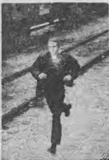
Es un mundo extraño donde se juega todo y se pierde todo.

«El rey del juego» es un film muy revelador en este aspecto. En este y en otros muchos. El mundo del juego y sus gentes aparecen pintados de mano maestra, con sus pasiones febriles, con sus lealtades y sus deslealtades. Ellos juegan con dinero; ellas, con amor.