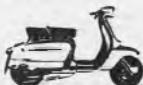
SCOOTERLINEA 125 de reducido consumo y gran rendimiento.