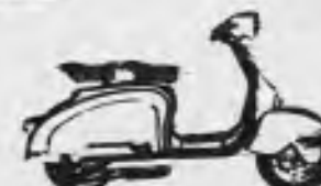
150 Robusta y económica.