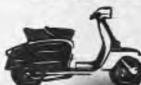
SCOOTERLINEA 150 en amplia gama de colores.