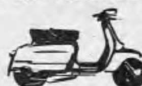
SCOOTERLINEA 175 deportiva con freno de disco.