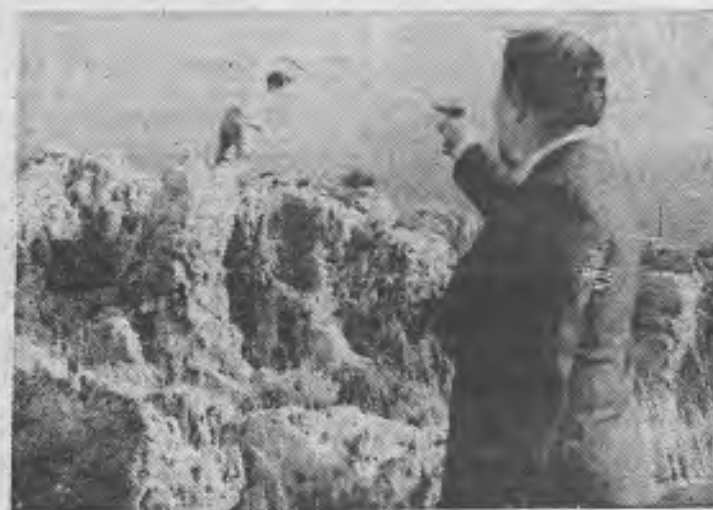
«Espías en Beirut», un film de aventuras de trepidante acción, justo a la medida de los espectadores que aman las emociones fuertes