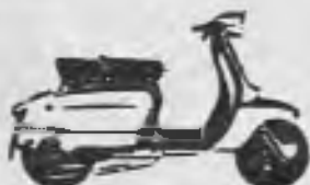
SCOOTERLINEA 125 de reducido consumo y gran rendimiento.