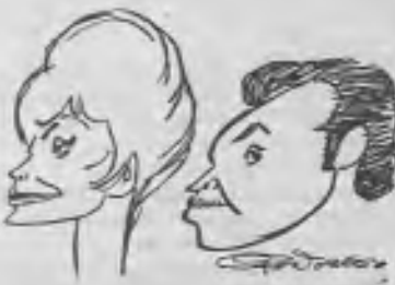
María Perschy e Ivan Desny

"LA ESFINGE SONRIE... ANTES DE MORIR" (CAPITOL)