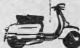
SCOOTERLINEA 175 deportiva con freno de disco.