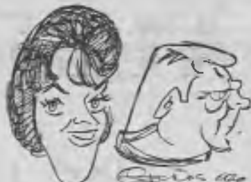
Françoise Fabian y Jean Gabin

"MAIGRET, TERROR DEL HAMPA" (ALCALA-PALACE Y EL ESPAÑOLETO)