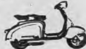
Li 150 Robusta y económica.