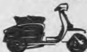
SCOOTERLINEA 150 en amplia gama de colores.