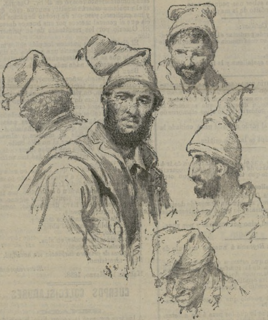
En el muelle de Oporto.

De esta formalidad creyeron poder prescindir va- rios fondistas de Berlín, cuando los funerales del Emperador, y abusando de la escasez de alojamien- tos causada por la afluencia de viajeros, exigieron precios superiores a los fijados de antemano. La po- licía ha recibido por esto varias quejas, y se forma causa contra los fondistas que han faltado a la ley.