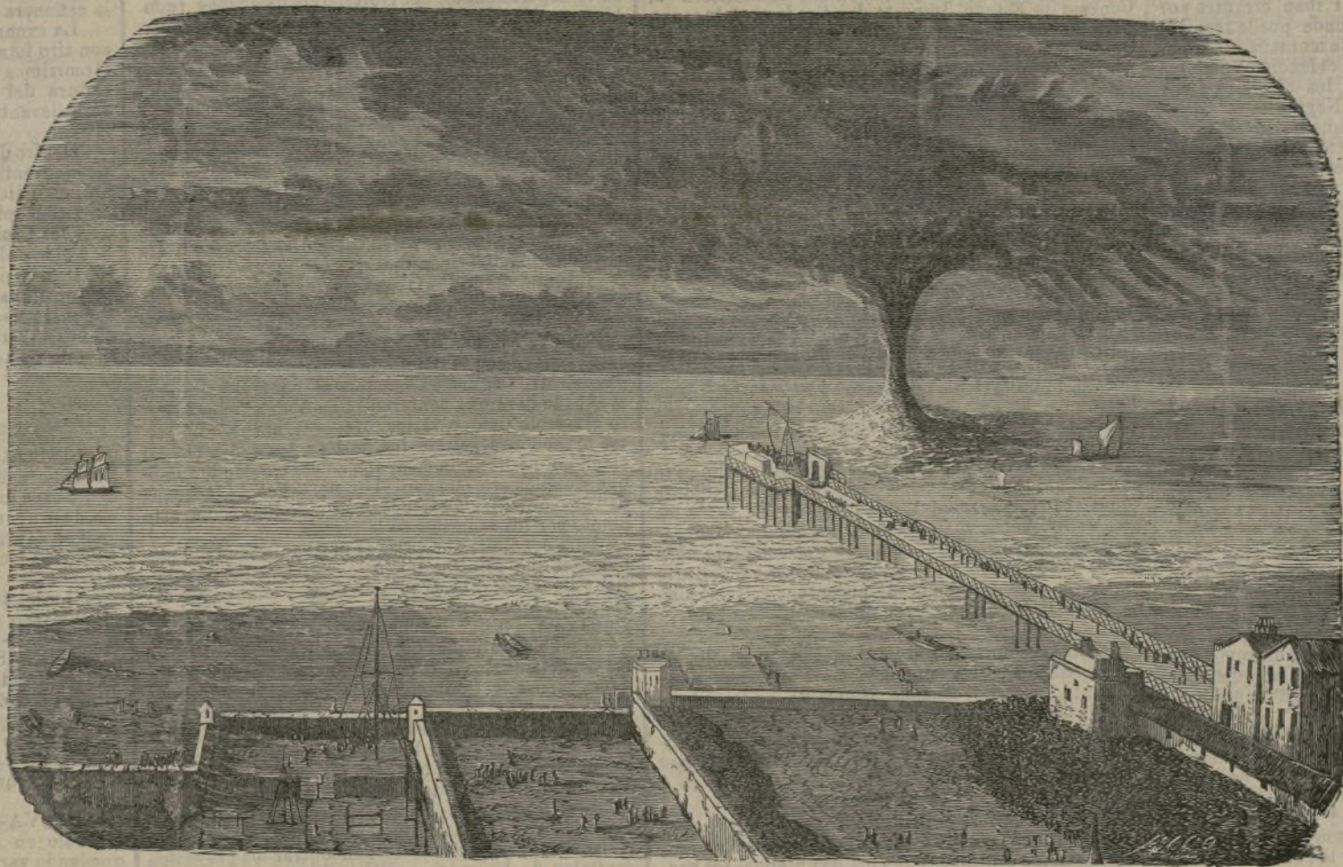
Formacion de trombas y mangas de agua.

Los efectos se modifican con arreglo a los tempe- ramentos y merecen estudio bajo el concepto físico- lógico.