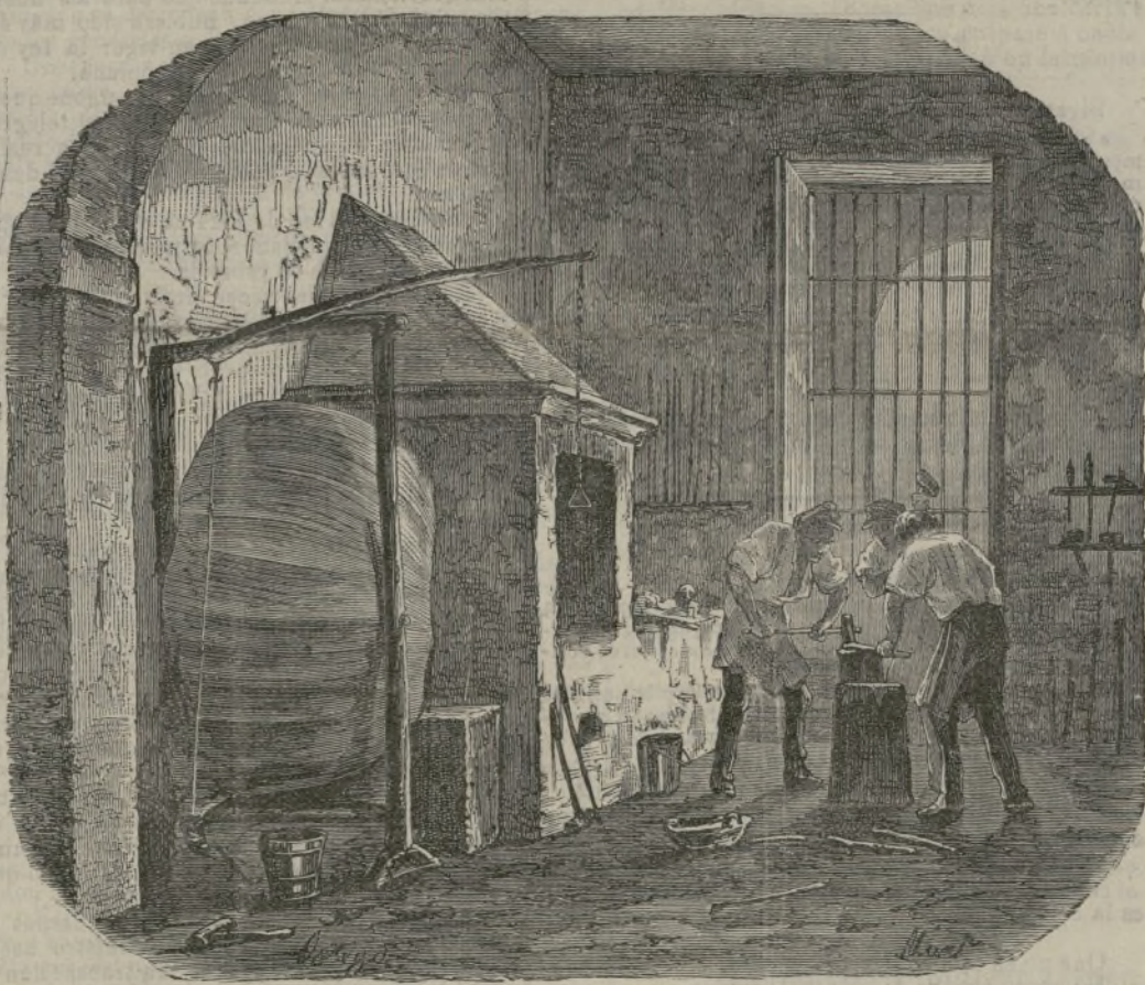
Fabricación de espadas en Toledo.

al salir por los pequeños y numerosos agujeros de la regadera parecía cabellera de cristal que trazaba, la tenderse en el suelo, dibujos caprichosos; transitaban pacíficamente los ganados de ovejas, y cuando alguna se detenía más de la cuenta no faltaba una piedra que la buesaca llevándole, de parte de la honda, eficaces y enérgicos recados de atención; un empleado del municipio encaramado en alta escalera secaba con paño de lágrimas los faroles del alumbrado, y en reunión patriarcal sentábanse las familias a las puertas de las casas y daban suelta a sus lenguas, platicando de amores los mozos, charlando los hombres de la pasada siega ó de la futura trilla y stareadas las mujeres (con la media ó el rosario entre las manos) en rezar oraciones piadosas ó en murmurar despiadadamente del prógimo.