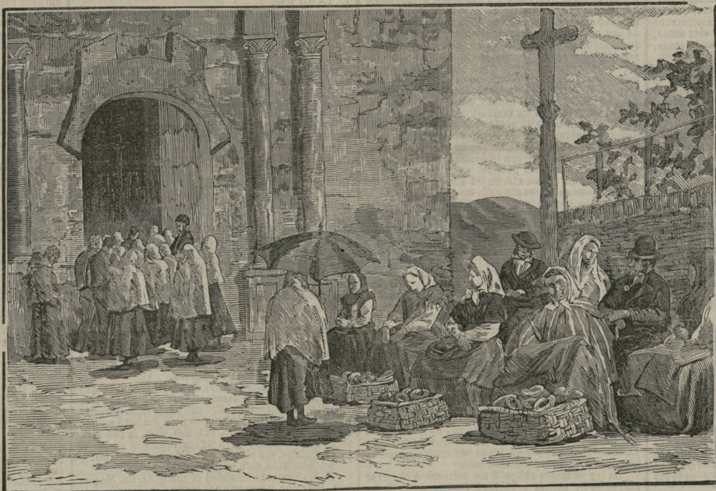
San Benito de Sotomayor.

Alfonso Manrique, quinto inquisidor general, quemó vivos, 2.250, en efígie 1.125 y condenó á cárcel ó galeras 11.250.