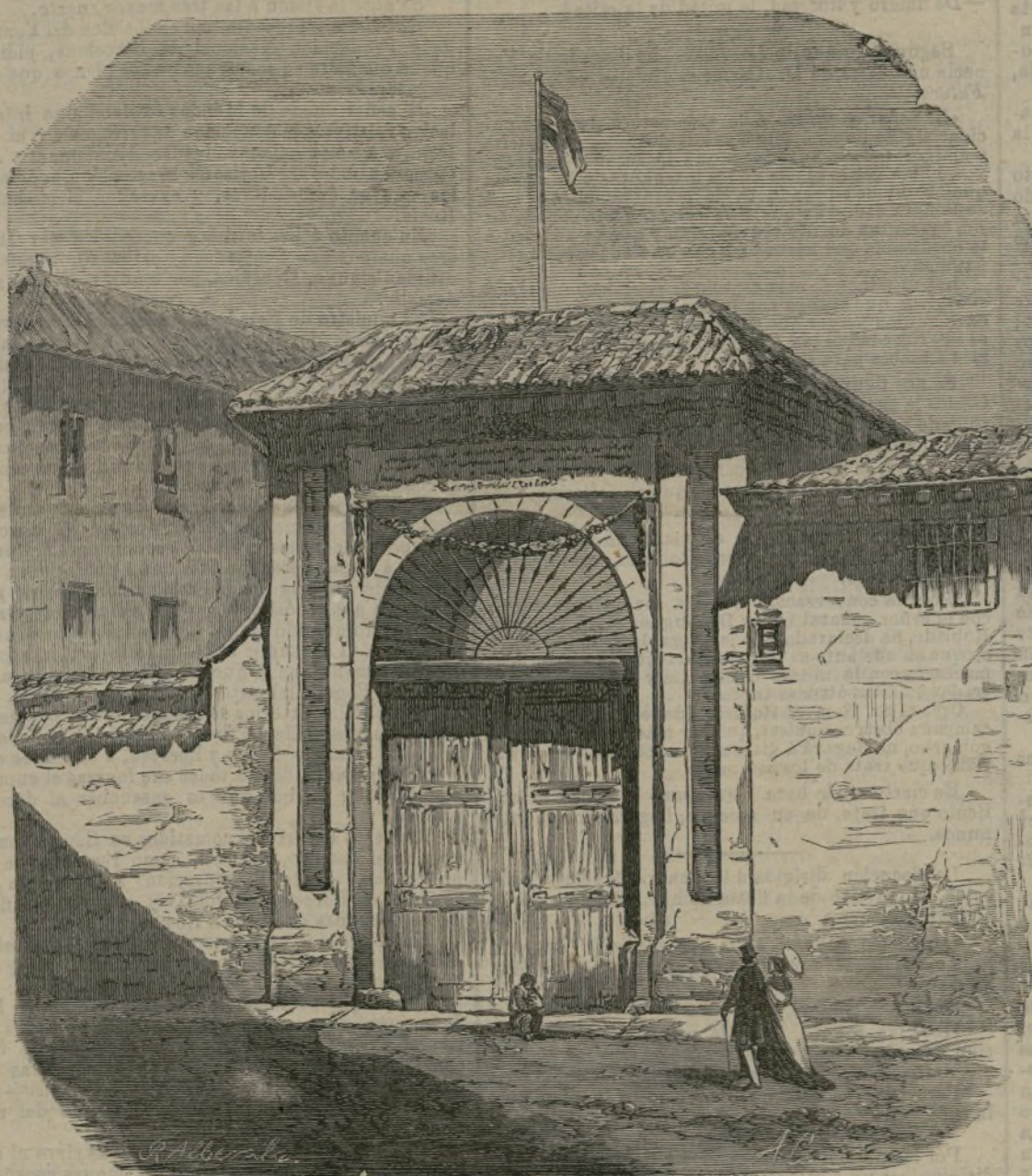
Parque de Monteleón.

En la estadística de los temblores de tierra ocurridos en 1886 y publicada por Flammarion, en su interesante revista mensual L'Astronomie , se dice que el 8 de Setiembre ocurrió en Seiba del Agua un terremoto, durante el cual salieron de la tierra varios chorros de agua. Los vecinos de esta capital sabemos muy bien, que lo que ocurrió entonces en el lugar citado, no fué un fenómeno seísmico, sino una simple inundación. Esta fué ocasionada por los excesos de las lluvias veraniegas, que sobrecargando de agua la laguna de Ariguacabo, aumentaron las filtraciones que de ella se derivan, y que salieron a la superficie en Seiba del Agua, y en otros lugares próximos.