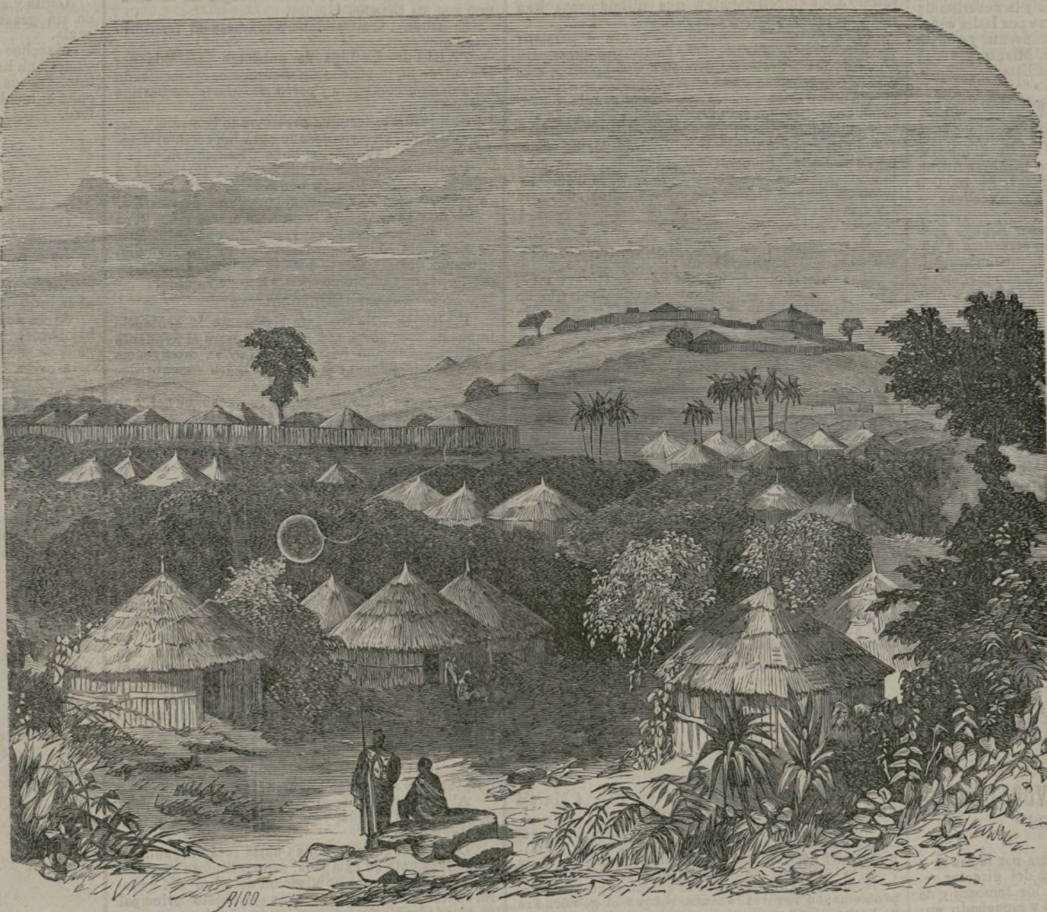
Debra-Tabor, capital de Abisinia.

Ese contacto descompone los elementos del agua, y la convierte en gas hidrógeno carburado y en oxígeno, el cual, uniéndose al hierro lo oxida, mientras el gas asociado dejando una parte que queda en estado gaseoso, y sale como en América cuando se le da lugar á ello y es el gas natural tan abundante allí, y otra parte se condensa, tomando el estado líquido, quedando depositada en una ó otra forma hasta que resulta extraíble por bombas ó manando, si el depósito está en condiciones de altura con relación de salida, como sucede en las aguas artesianas.