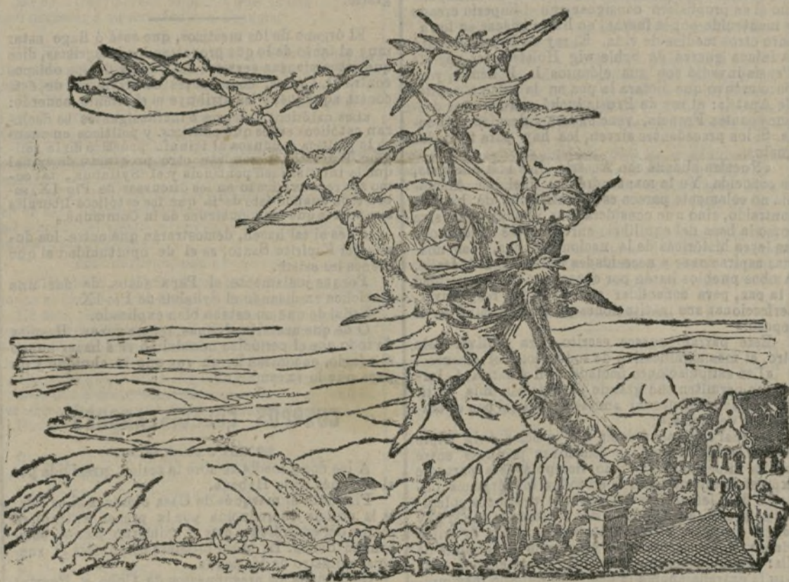
El arte de volar.

Varias balas de cañón, de 15 pulgadas, tan pe- sadas que difícilmente podía un hombre levantar una de ellas, quedaron suspendidas en el aire una debajo de otra; lo que hace suponer que la historia de la suspensión entre imanes del atand de Maho- ma, no es tan fabulosa como se ha creído.