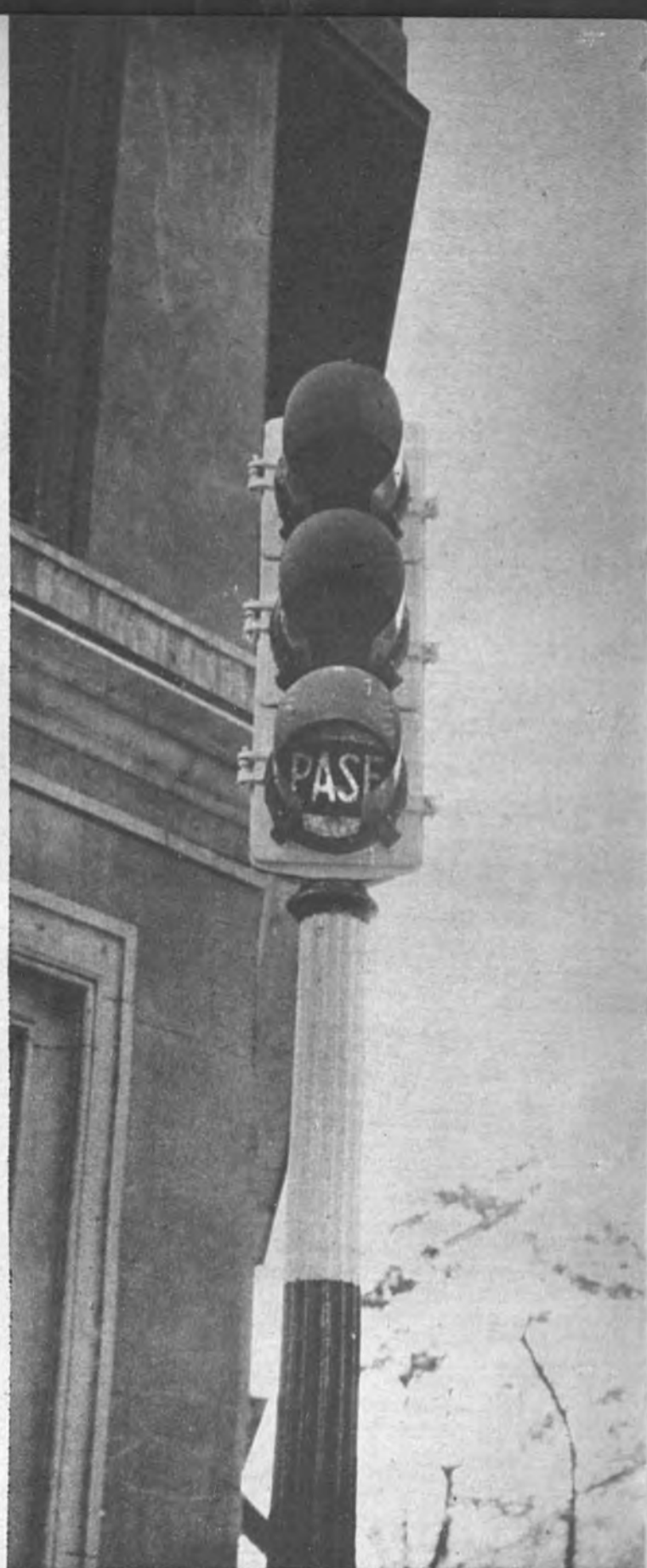
LECTURA PARA AUTOMOVILISTAS Y PEATONES. —Algunos semáforos de Madrid añaden a su sistema de luces, letreros que dicen "pare" o "pase".—(Nuño.)