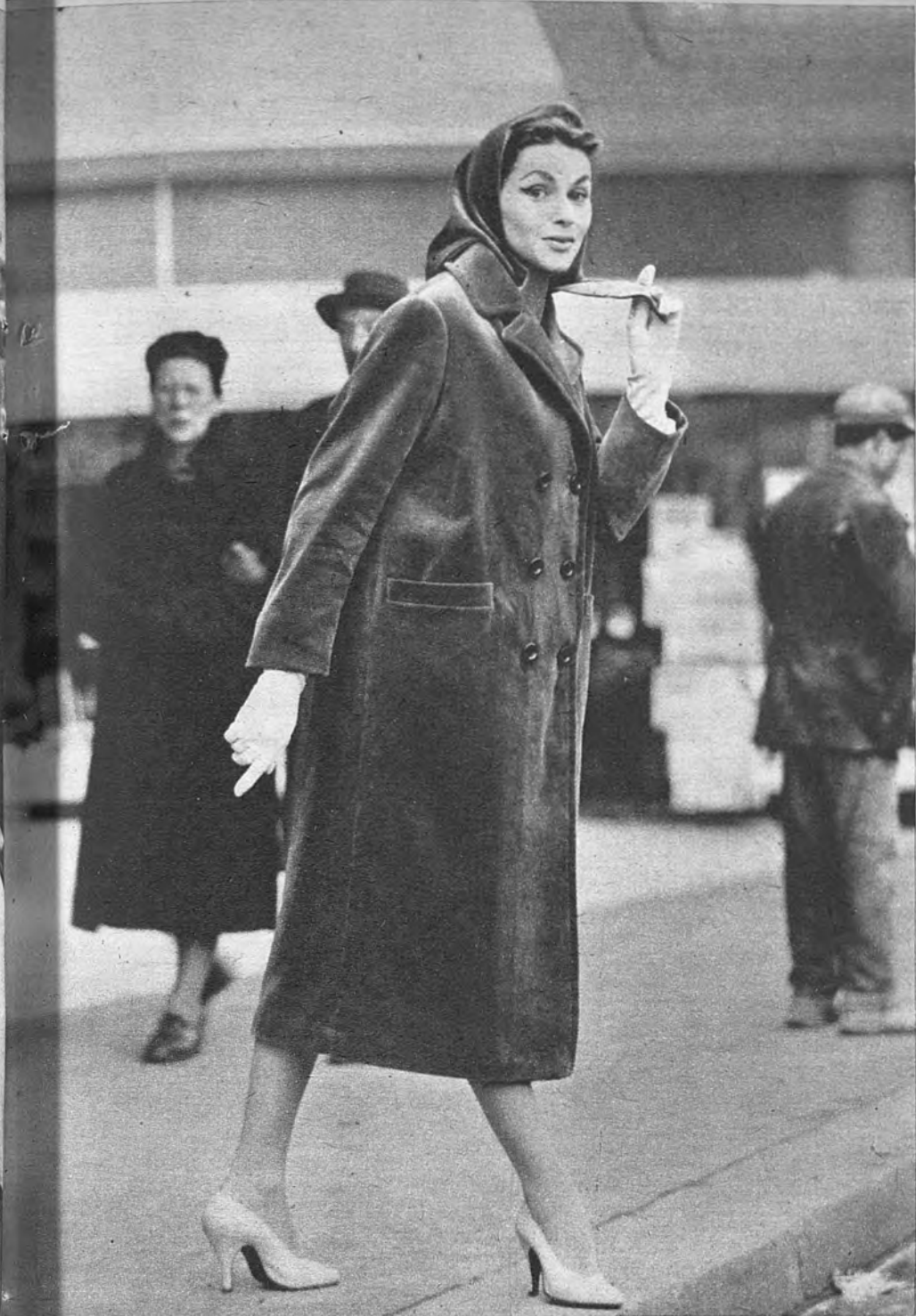
Impermeable, de Ogliss, en terciopelo "Sporvel", azul pavo