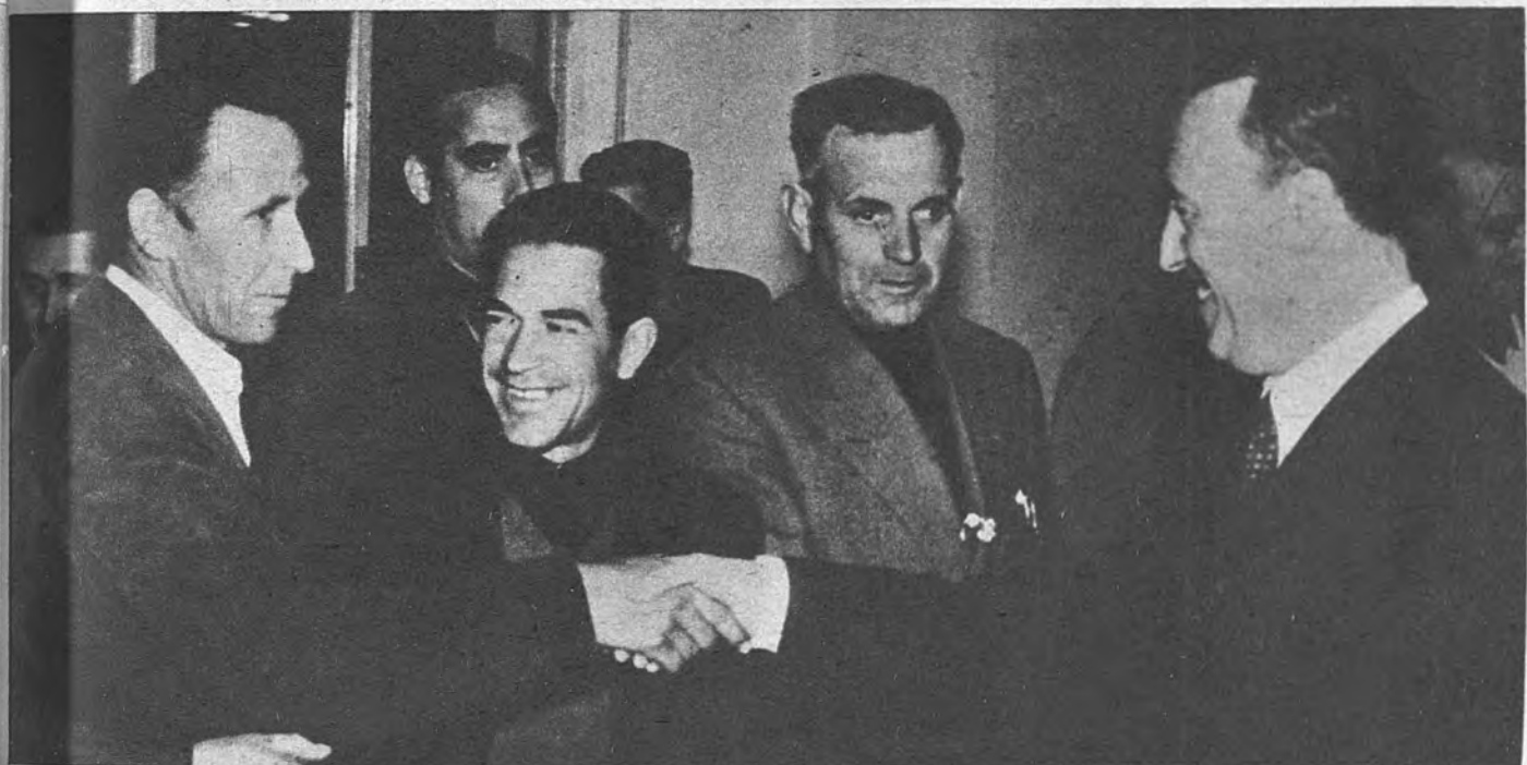
EL MINISTRO DE TRABAJO, EN ALBACETE. —El Ministro de Trabajo, Fermín Sanz Orrio, aparece en la fotografía en cordial entrevista con un grupo de productores de la Organización Sindical de Albacete, en la visita que ha realizado a dicha ciudad, donde conoció la nueva Casa Sindical, de reciente construcción