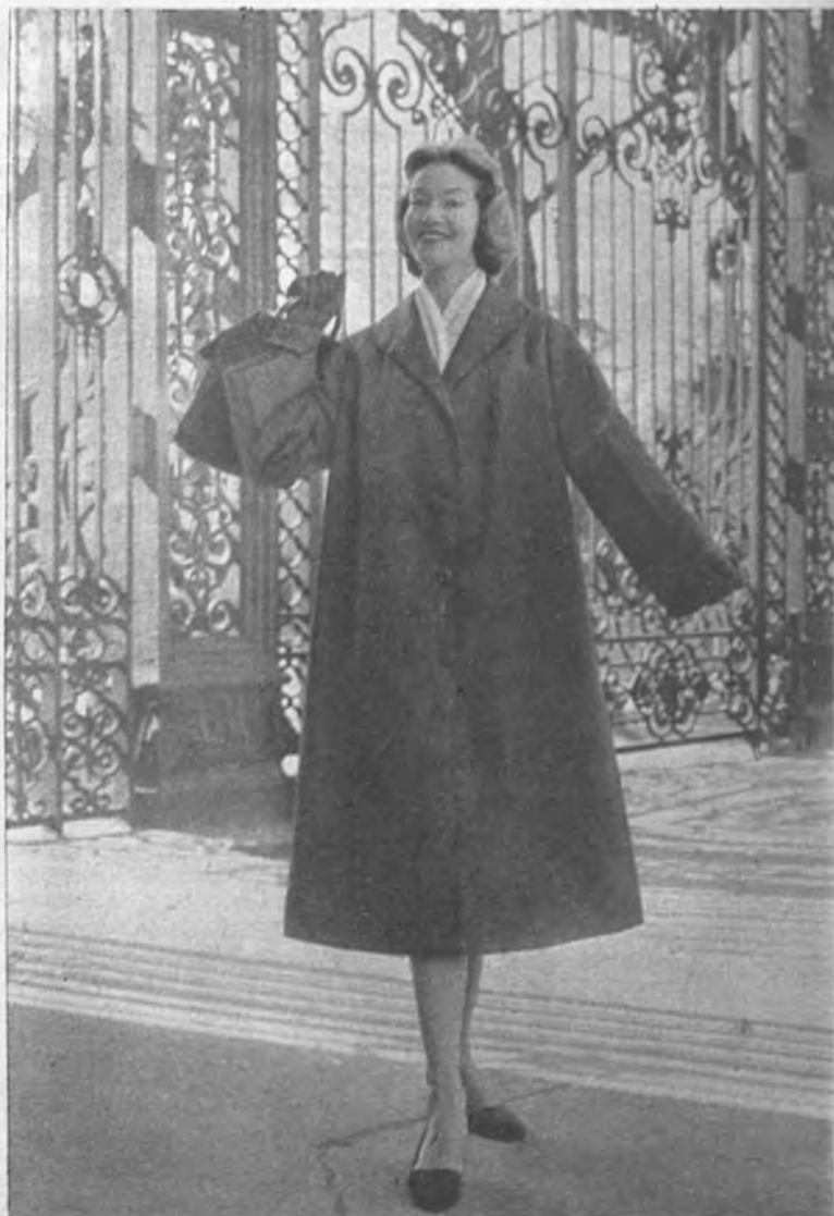
Impermeable, de Arnyl, hecho de nylon "Nylfrance"

Lo que parece buscar Desto, otro especialista del impermeable femenino, es que sus modelos rejuvenezcan. Y en efecto, con cualquiera de los impermeables de «Satinjap» rayado en camagüey gris, se tiene un aire juvenil. Los botones de metal de sus modelos y el sombrero pequeño del mismo tejido del impermeable que los acompaña contribuyen a acentuar esa elegancia juvenil de la prenda que favorece, y rejuvenece, protegiendo a la mujer frente al sol y bajo la lluvia.—J. S.