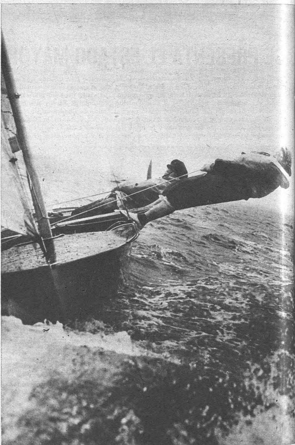
EQUILIBRIO INESTABLE. —Aquí tienen ustedes ocasión para el asombro, en este bello momento de las regatas celebradas en Chichester Harbour, Inglaterra, con el esfuerzo de los tripulantes por mantener la verticalidad de la embarcación