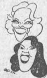
Rosa Carmina y Anita Hallan

Cumple al cine español acometer todos los géneros, y natus y natus, como uno de los principales, el cómico, en cualquiera de sus variantes, del finamente ingenioso a la ficción urdida para el lucimiento de unas cuantas figuras del canto y del baile, dedicadas