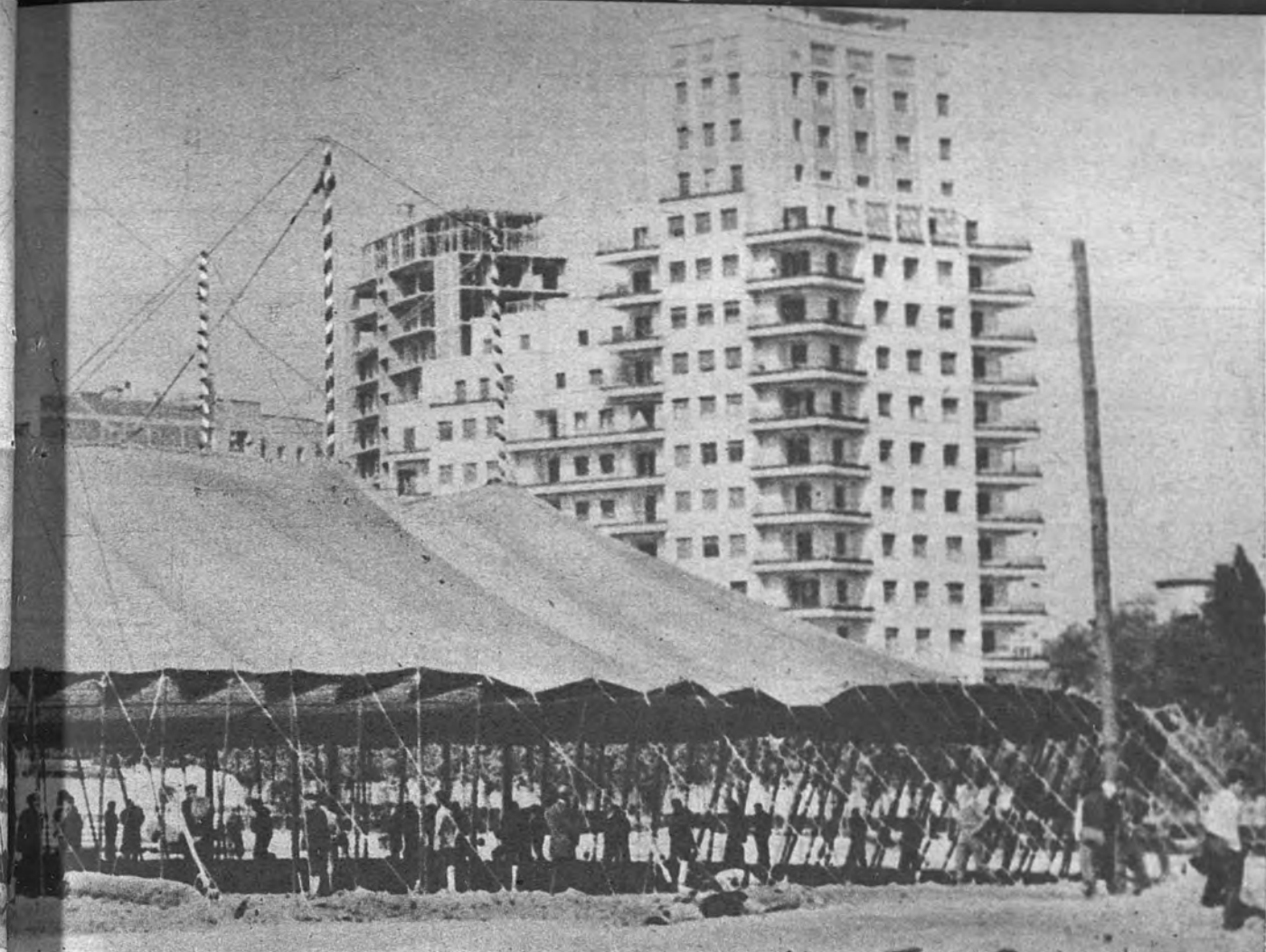
ad y ha levantado, en un claro paisaje urbano, sus alegres andamios para la fantasía. El mágico redondel que ilumina es. He aquí el tinglado de la antigua farsa que vulnera y pone en entredicho las leyes físicas del mundo.—(Alcoba.)