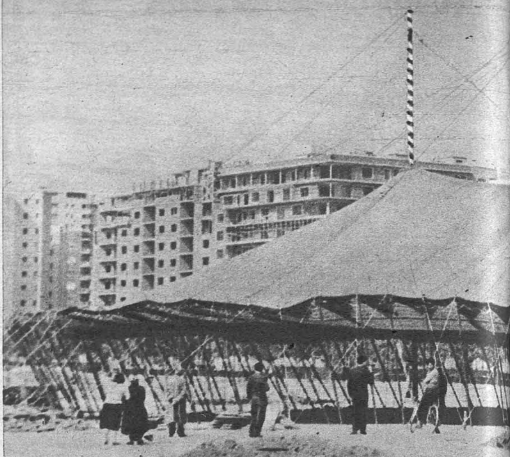
EL CIRCO LEVANTA SU TIENDA. —Como salta a la vista en la foto, el circo ha llegado a la fiesta de la vida con un soplo de ternura y milagro, volverá a encandilar a pequeños

DISTRIBUIDOR: F. del Campo - Príncipe, 12 - MADRID