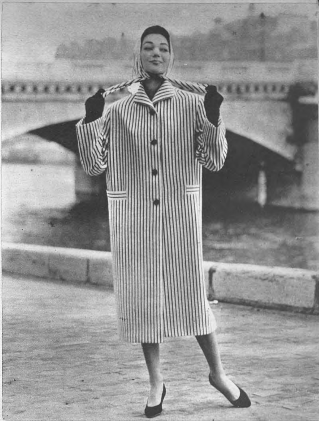
Impermeable, de Ogliss, en satén de lana, impermeabilizado, de "Jap". París