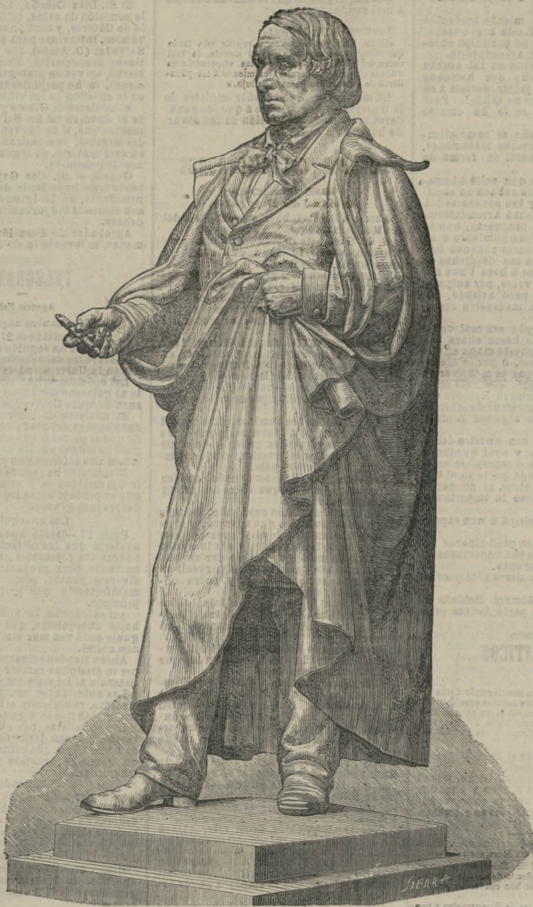
Estatua del pintor Cornelius.

Es bien sabido que nuestro desarrollo pende de causas puramente físicas. Los alimentos, el ejercicio, las ocupaciones, fortalecen ó debilitan al individuo. Esto prueba que dependemos de causas externas. ¿Quién puede negar que la luz contribuye al desarrollo de los ojos, y los sonidos al de los oídos? De esto se deduce que nuestro cuerpo, nuestras facultades intelectuales mismas, están modeladas por las causas existentes en la naturaleza, lo mismo que el metal fundido se ajusta a las configuraciones del molde.