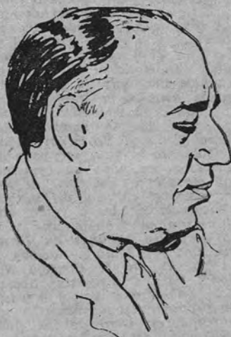
Presidente Héctor B. Trujillo

Las consecuencias de esta catastrófica situación eran más que visibles en 1930; el país tenía una deuda de cincuenta millones de dólares con Haití, otra de dieciséis millones con los Estados Unidos—que como hipoteca se había encargado de percibir los derechos de aduanas—, su presupuesto se elevaba únicamente a siete millones de dólares, su industria era prácticamente inexistente, las luchas intestinas habían privado de personalidad al país—estratégicamente situado en la encrucijada del mar del futuro—, y por si fuera poco, un trágico huracán destruyó Santo Domingo aquel mismo año. Estos son hechos. El Presidente Leónidas Trujillo tuvo que par-