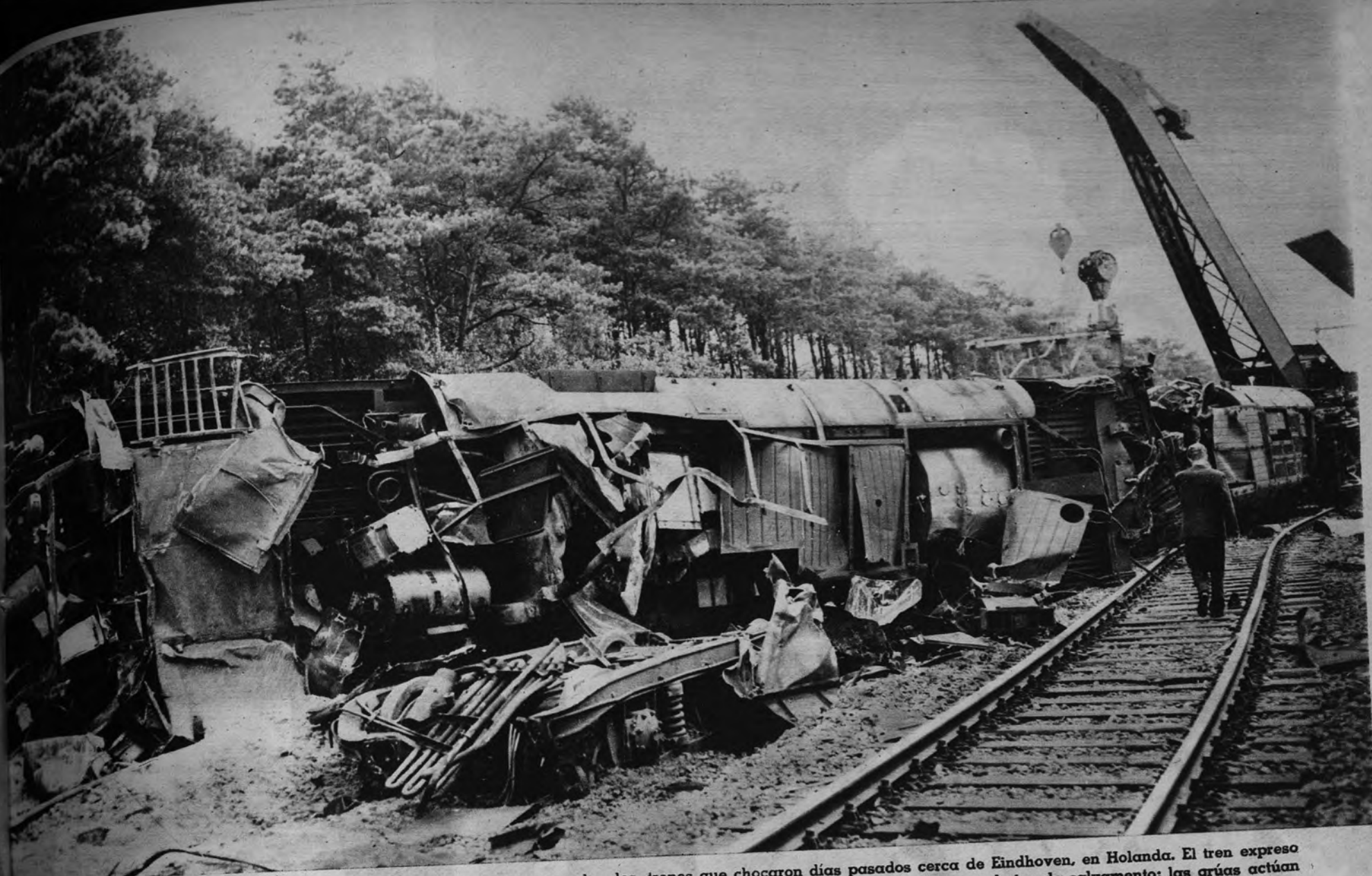
CHOQUE DE TRENES. —Estos vagones destrozados y tendidos pertenecen a los dos trenes que chocaron días pasados cerca de Eindhoven, en Holanda. El tren expreso Eindhoven-Rotterdam chocó con el que salió de Amsterdam con dirección a Maestricht. En la fotografía se pueden ver los trabajos de salvamento; las grúas actúan para dejar la vía libre. En el desgraciado accidente encontraron la muerte varias personas y otras muchas resultaron heridas.