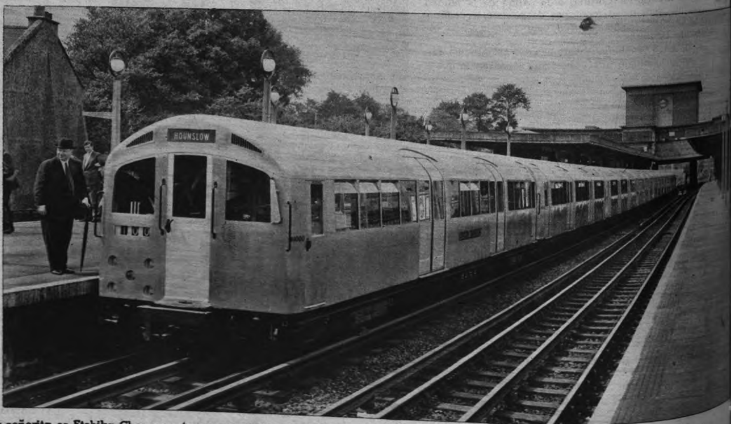
TREN DE PLATA. —Este tren eléctrico, ligero y confortable, ha sido construido en aluminio y parece como de plata. En Londres prestará servicios en las líneas suburbanas y ha sido presentado recientemente a los periodistas.