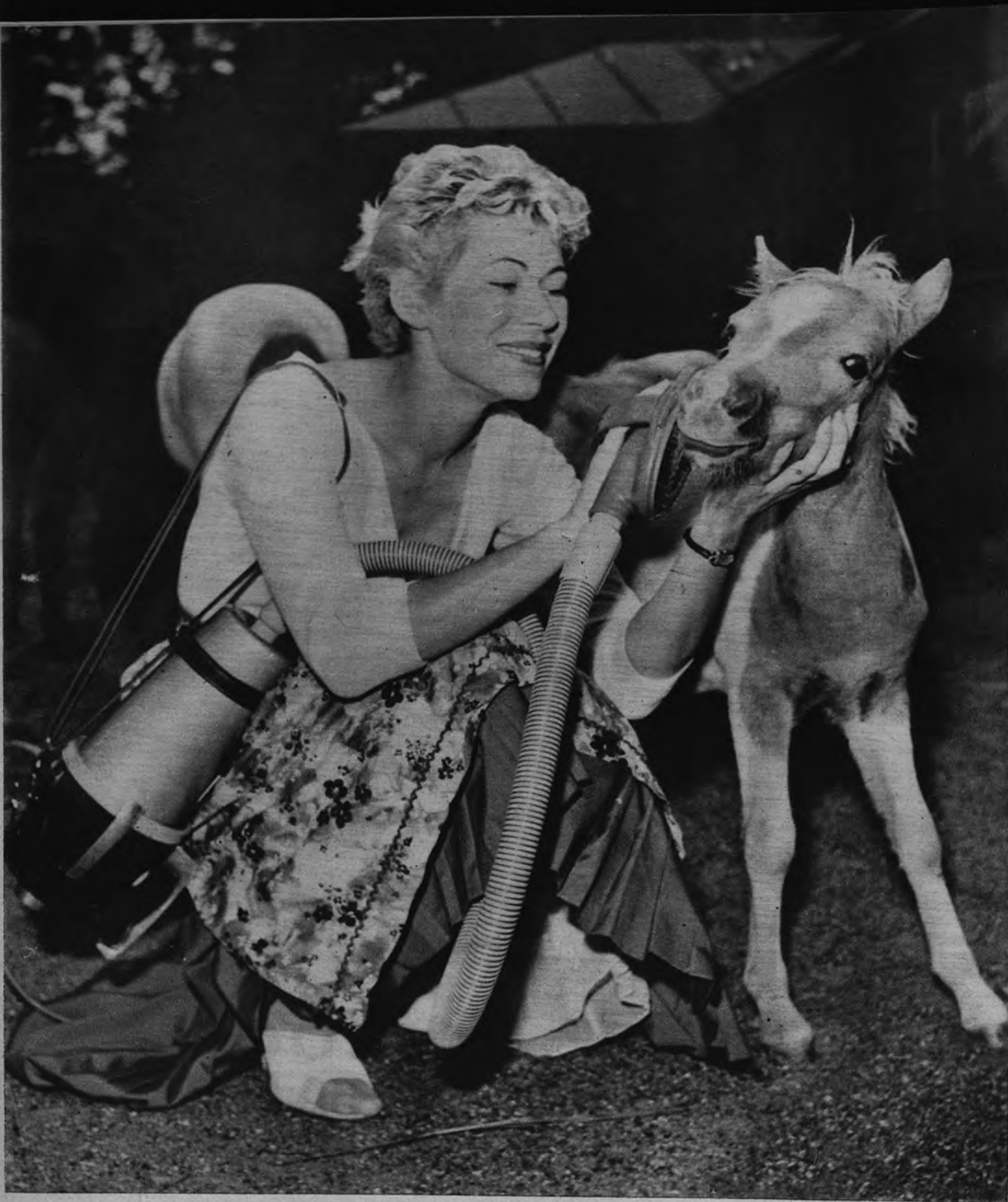
AFEITADO ELECTRICO. —Esta señorita, tan rubia y tan guapa como es, ha venido a encapricharse del tierno y dulce caballo enano, y a su cuidado se dedica con cariñoso celo. Para limpiarle el morrito utiliza este cepillo eléctrico.