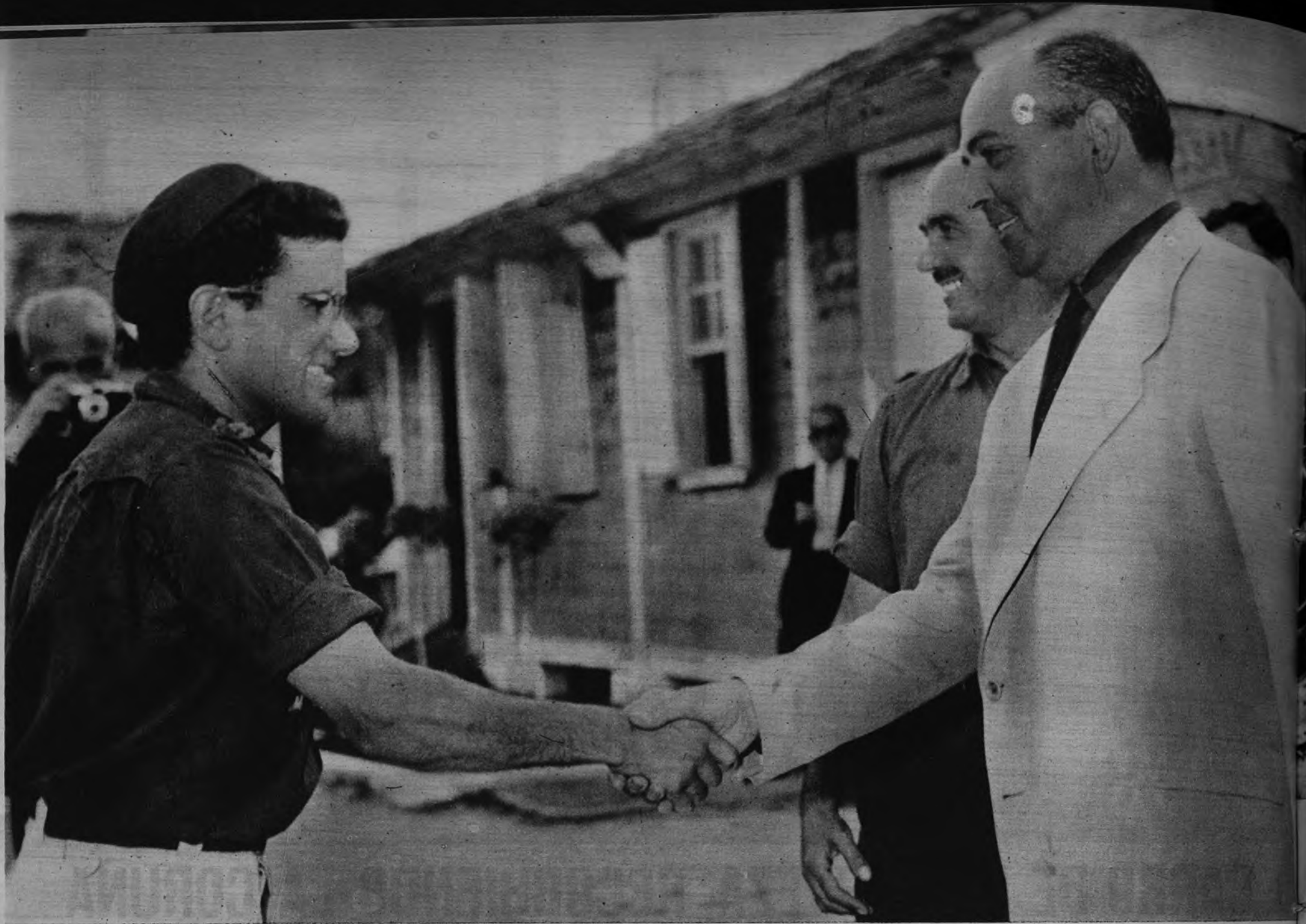
CAMPAMENTO DE GANDARIO. —De la clausura del Campamento "Francisco Franco", que el Frente de Juventudes de La Coruña tiene instalado en la playa de Gandario, ofrecemos hoy este reportaje gráfico, que nos muestra, sucesivamente, la felicitación del Ministro Secretario General del Movimiento a un joven camarada; el momento de arriar las banderas, y el desfile de todos los acampados hacia la Cruz de los Caídos con el homenaje de la corona de laurel.