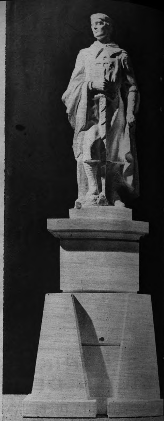
ESTATUA DE DON ALVARO. —El escultor Carlos Monteverde ha esculpido este monumento a Don Alvaro de Luna. La estatua del famoso político español del siglo XV será erigida en San Martín de Valdeiglesias.