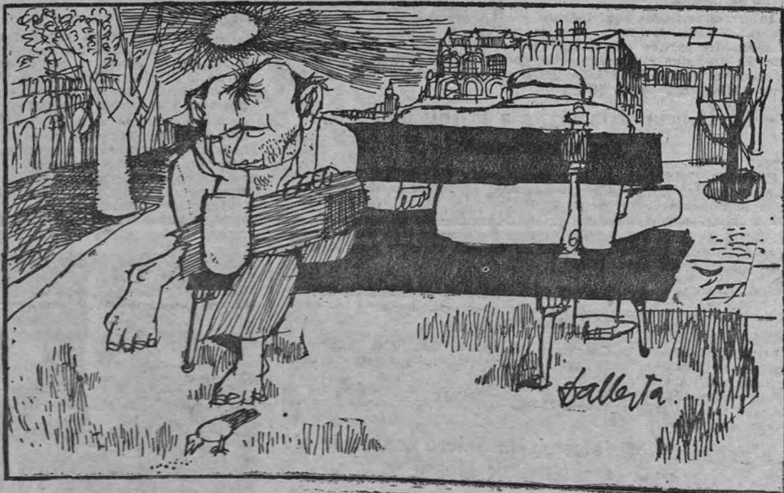
—He venido al banco, ¿y qué?