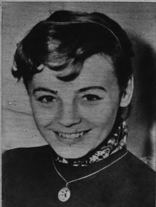
POSIBLE PRINCESA. —Esta joven y graciosa señorita es Etchika Choureau, famosa actriz de revistas francesa. Se dice que es novia del príncipe marroquí Muley Hasán, y ha salido del aeropuerto de Orly con destino a Rabat.