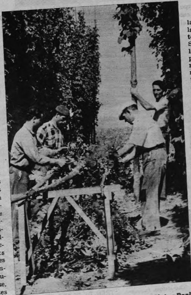
Recolectores de lúpulo en Betanzos. (F. Veiga-Roel.)