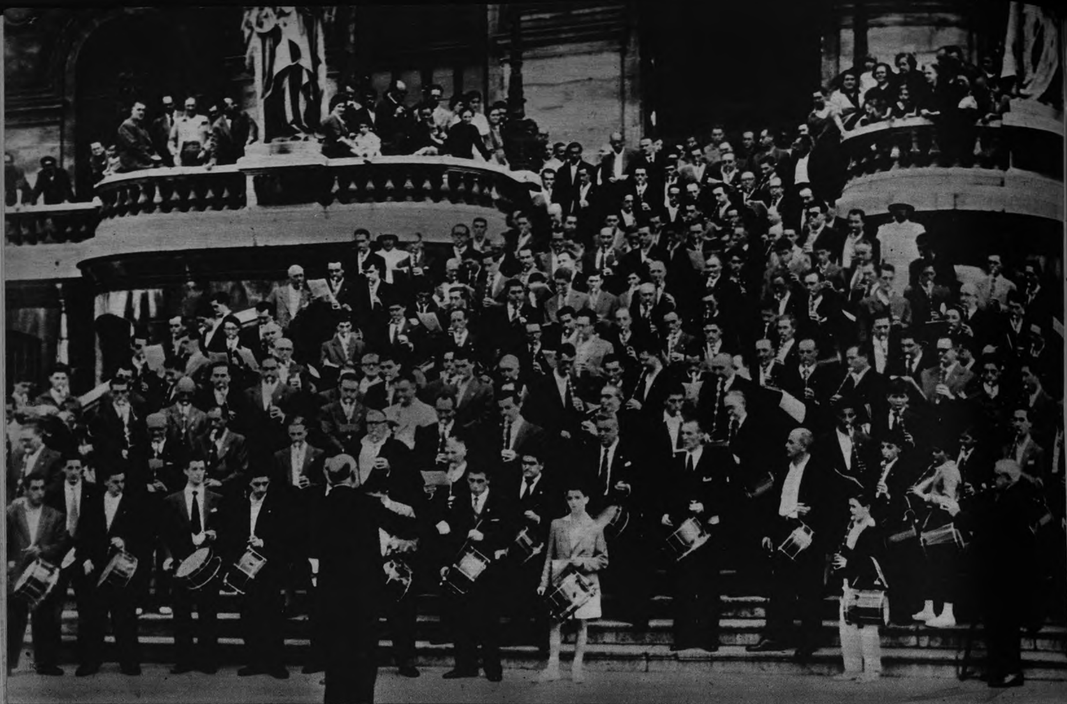
TXISTULARIS. —En Bilbao se ha celebrado una concentración de txistularis a la que han asistido casi todos los del País Vasco. La presente fotografía ha sido obtenida en dicha ciudad, en las escaleras del edificio del Ayuntamiento, donde todos los txistularis reunidos ofrecieron al vecindario un magnífico concierto, que fué escuchado con sumo interés por una gran cantidad de público, al que podemos ver asomado en los balcones de la entrada.