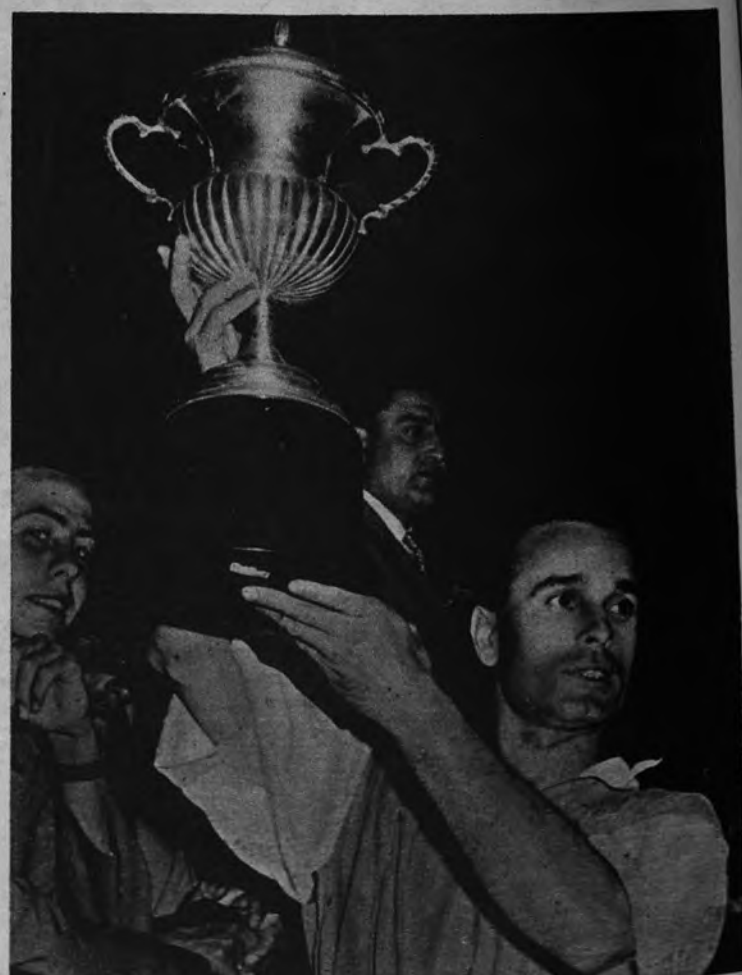
PATRON VENCEDOR. —En Santander se celebró el Campeonato de España de Bateles de Educación y Descanso. Fué ganado por el batel bilbaíno "Babcock Wilcox", cuyo patrón saluda al público alzando el trofeo ganado en dicha prueba deportiva.