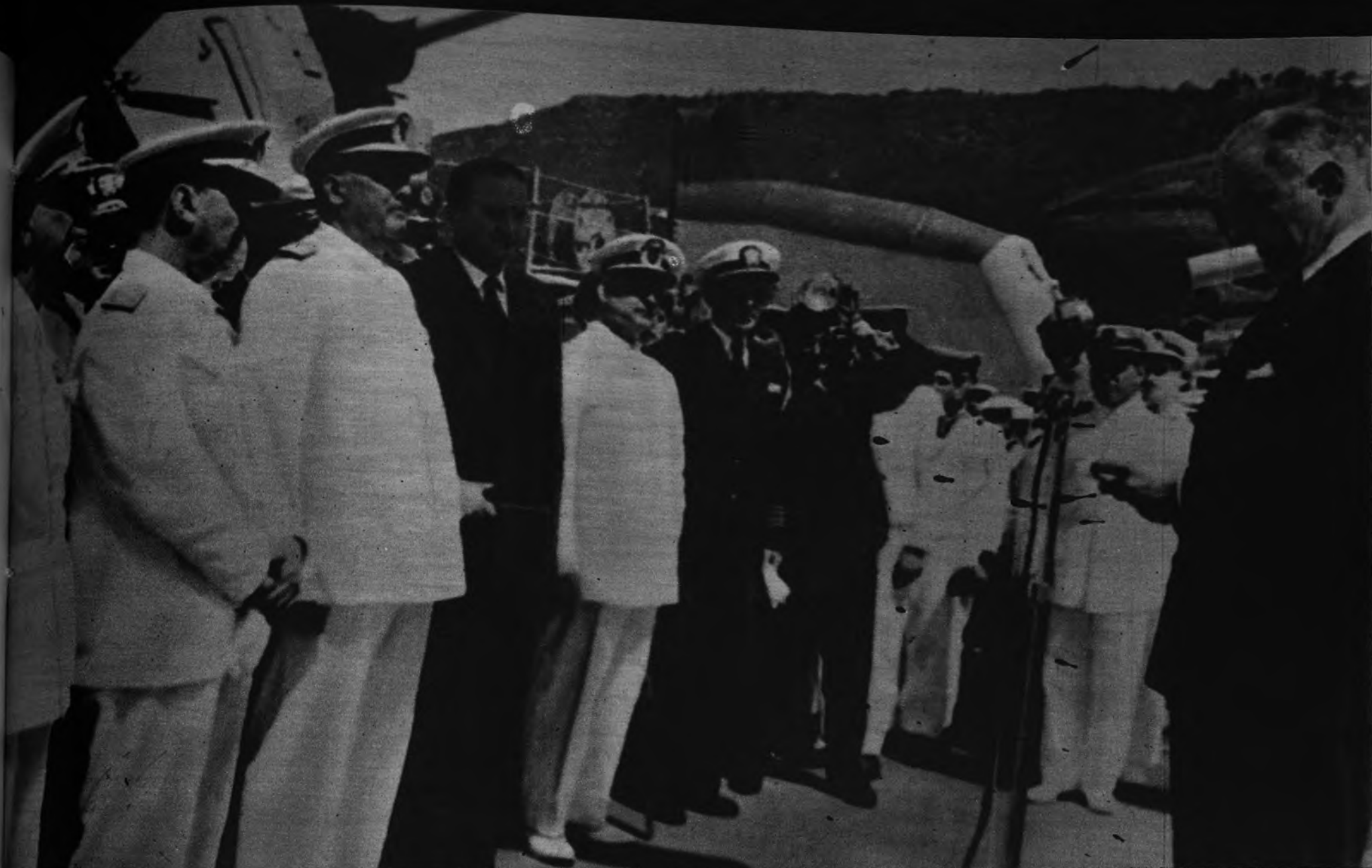
REGRESO DEL ALMIRANTE ABARZUZA. —El almirante Abárzuza, que ha realizado una visita a Estados Unidos, regresó a España a bordo del destructor "Lepanto". El barco entró en el puerto acompañado del "Ferrándiz". La fotografía recoge un momento del acto celebrado a bordo del "Lepanto": el embajador de los Estados Unidos, mister Lodge, pronuncia unas palabras que son escuchadas por los Ministros de Marina, Asuntos Exteriores y Subsecretario de la Presidencia.