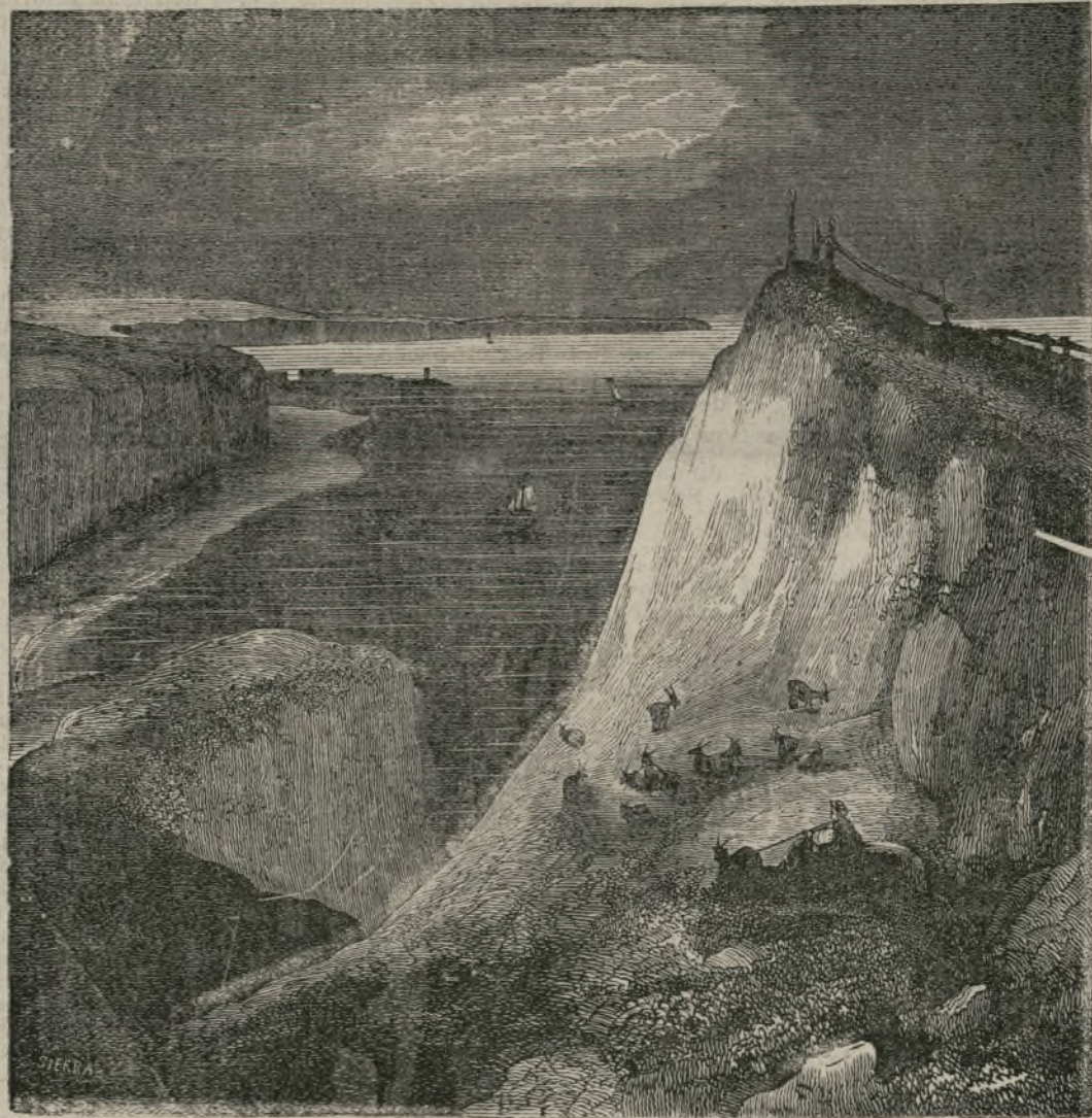
Panorama del puerto de Dieppe.

Para terminar esta ya muy larga lista diremos que Bélgica, Portugal y la Santa Sede tienen la Orden de Cristo y Suecia la de los Serafines.