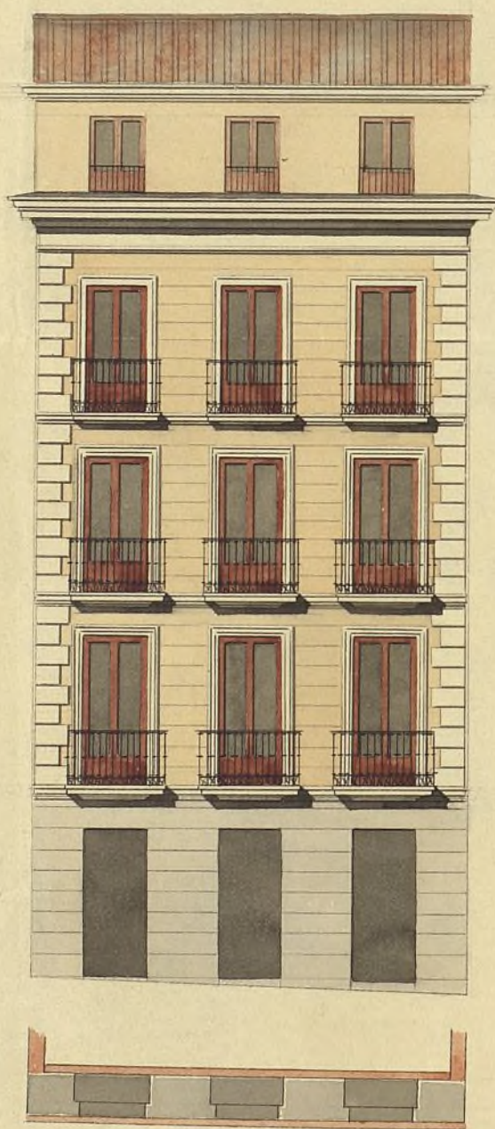
Calle de Espoz y Mina