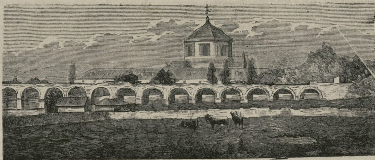
Acueducto y Hospicio de Oviedo.

Aquel día, el profesor Walcott, presidente de la academia de medicina de Bos-